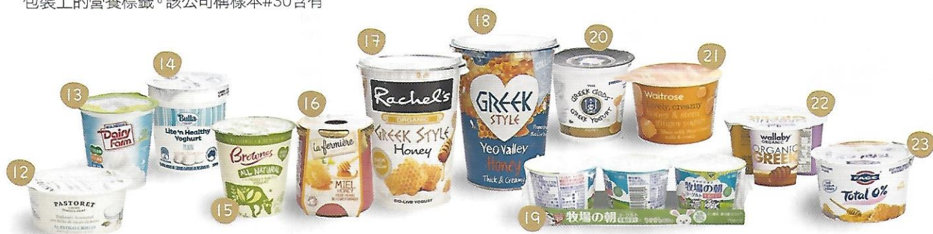
表三：市面部分預先包裝乳酪的糖含量（原味添加糖，包括蜜糖）

「Pastoret」的生產商表示沒有計劃減少樣本#12及#24的糖含量。該公司稱樣本#12只含7.7%糖，相比其他公司的產品糖含量已經較少，又表示樣本#24使用了甜味劑甜菊醇糖苷，因此沒有添加糖。