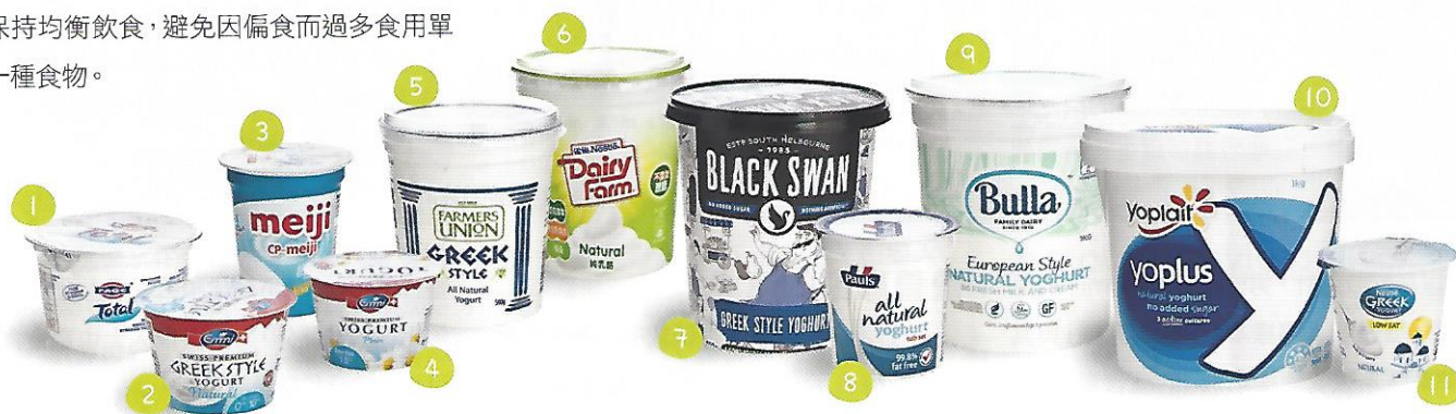
表二：市面部分預先包裝乳酪的糖含量（原味無添加糖）

「CP-Meiji」（#3及#36）的生產商表示乳酪本身含天然乳糖，不屬於游離糖。該公司稱最受市民歡迎的水果味乳酪每100克的糖含量約為12-16克。雖然添加代糖或甜味劑能減少游離糖，但該公司不鼓勵使用代糖，而會使用天然的配料製造產品，並表示目標是將產品的總糖量減至每100克