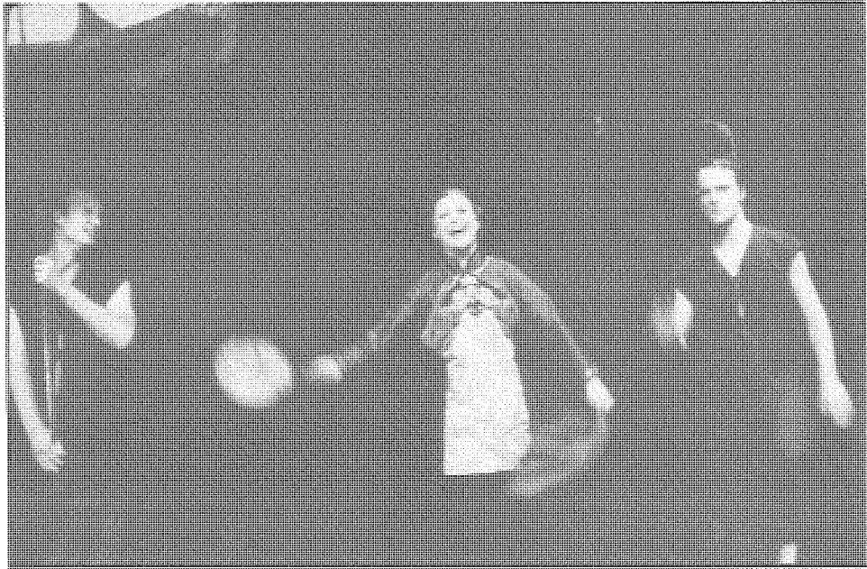
《野人》：林兆華導演 德國漢堡塔里亞劇院 (1988)

紙評論認為這個戲展現了「一個近乎原型的女人」。而我的新戲《夜遊神》則試圖寫出個原型的男人或者人。《對話與反詰》借用了禪宗公案的對答方式，對語言提出質疑。語言能否充分表述人的存在？在語言的遊戲背後，那不可知或許才是人的本性？抑或，語言的虛妄也即人的虛妄？