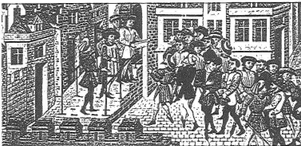
圖 市民社會怎麼會發生，不同的理論家有不同的看法。

對於特殊性原則是否被肯定這點標誌古代社會與現代社會以及東方社會與西方社會的差異，以及古代社會中無法容納特殊性，黑格爾有這樣一段話 ⑬ ：