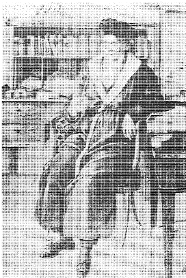
圖 黑格爾給市民社會所下的定義，與自由主義者們對於國家的定義是相同的。