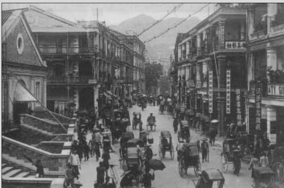
百年前的中區街道

一個半世紀以前，香港只是一個小小的漁村。當時英國來華貿易的船隻，往往停泊在尖沙咀。他們大多在石排灣附近的山坑取水食用，人們愈加感到這是一個具有深遠戰略意義的天然深水良港。從此，這個小漁村開始了翻天覆地的變化。今天我們在追溯香港這個國際大都會的成長歷史時，對她的景觀如何演變十分感興趣。表面上看，現代城市的發展猶如孩子成長，人口漸漸增多，街道的拓