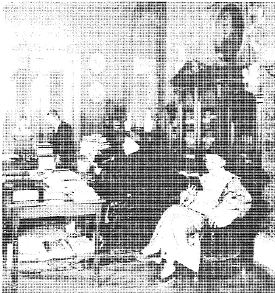
圖 本位文化派主張文化選擇，同時還提出要用科學的方法來指導這種選擇。