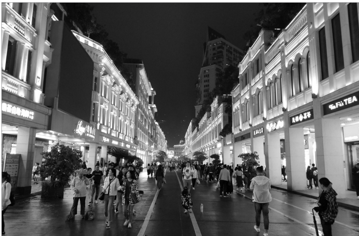
以2010年為界,中國經濟增長率從10.6%逐年拾級而下。(資料圖片)

以2010年為界,經濟增長率從10.6%逐年拾級而下。在仍有巨大增長潛力的情況下,中國經濟於2015年後脫離了延續三十八年的高速增長軌道,增長率降到7%以下。2019年降至6.0%,2020年在內需不振和新型冠狀病毒肺炎(COVID-19)疫情衝擊的雙重影響下,降至2.3%(但疫情影響是特殊情況,該年經濟情況仍較世界各主要國家為佳)。