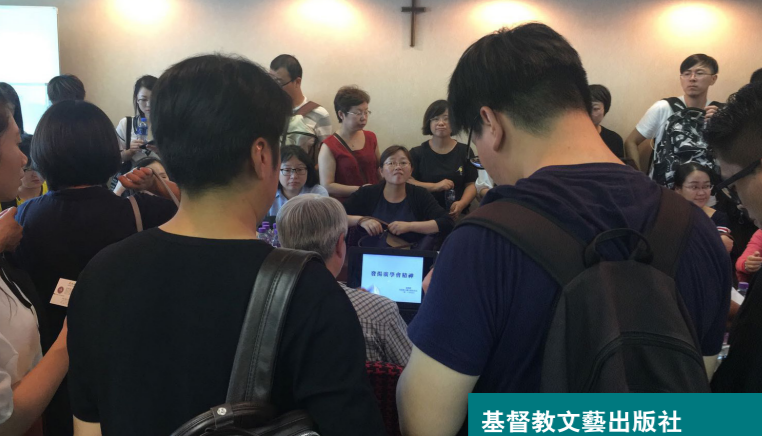
基督教文藝出版社