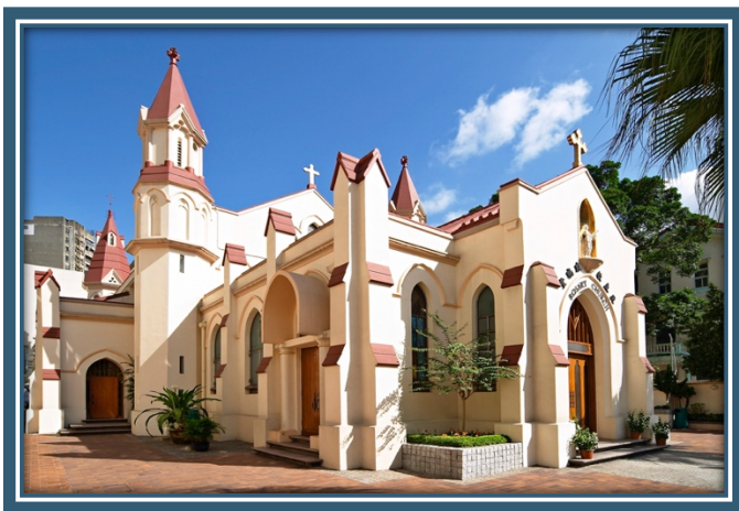
圖：2003 年建過翻修後的玫瑰堂

該堂的神職人員在二、三十年代，亦需要照顧九龍塘、九龍城以至油麻地一帶的教友，直至 1932 年太子道聖德肋撒堂及 1955 年深水埗聖方濟各堂建成為止。1949 年，玫瑰堂升格為堂區。戰後，為了容納當時從中國湧入的難民及不斷增加的本地信徒，聖堂於五十年代重建為今天的面貌。1990 年，香港古物諮詢委員會將之列為二級歷史建築，2010 年改列為一級歷史建築。