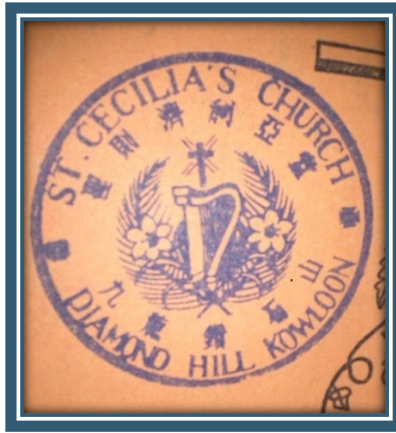
圖：聖則濟利亞堂印鑑