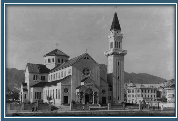
圖：早年的聖德肋撒堂

Van Wylick ) 的心思，將聖德肋撒堂建成一座有圓頂和尖塔的拜占庭式教堂。