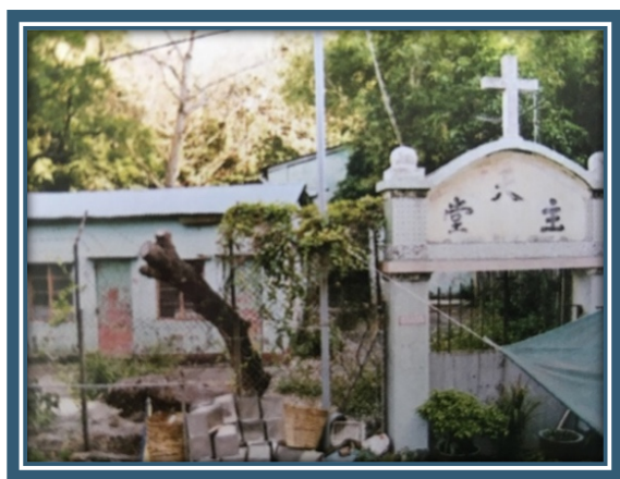
圖：鯉魚門聖雅各伯小堂