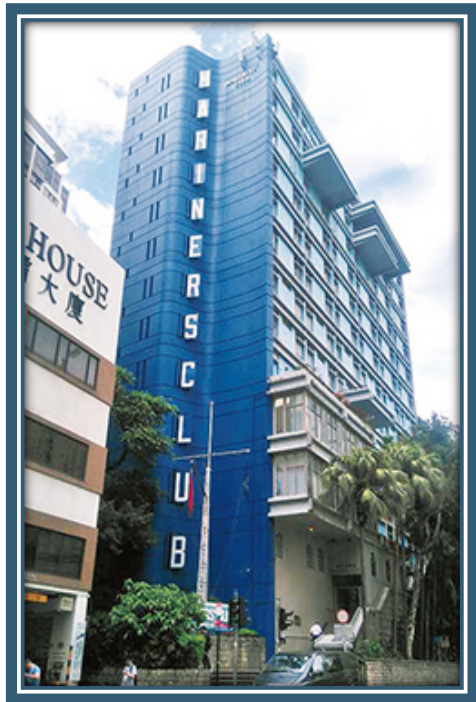
圖：中間道海員之家

除了基層社區的傳教工作，戰後香港工業起飛，教會對於工人階級的牧養也有所關注。香港海員之家源自 1863 年西環西營盤一間海員宿舍，主要由渣甸公司等商行建成，專供在洋船上工作的海員住宿。該宿舍設有跨宗派的聖伯多祿堂（聖彼得堂）。原屬於聖公會的海員傳道會於 1884 年開始在港發展，翌年獲准在聖伯多祿堂舉行崇拜。1901 年海員傳道會的宿舍於灣仔莊士敦道落成，約三十年代，海員傳道會與海員之家共同註冊為海員組織。他們後來建成的新會所，於日治時期遭嚴重破壞。新的海員之家會所於 1967 年在尖沙咀中間道落成，由時任港督戴麟趾（Sir David Trench）揭幕。兩年後，天主教的海員宗會加入此跨宗派牧民服務，及後丹麥及德國的海員傳教會也加入其中，並定每年七月第二個主日為「航海主日」。初期名為聖伯多祿海員堂的教堂同時舉行天主教彌撒及聖