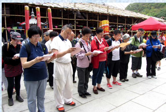
▲ 在天后宮前誦讀天后寶誥