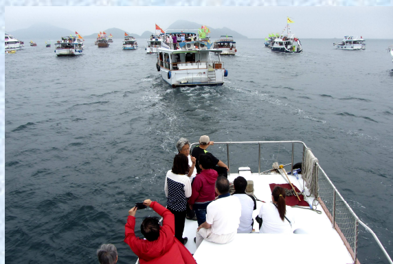
▲ 坐在甲板上觀看天后出巡船隊