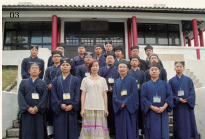
03 學員考察道風山基督教叢林