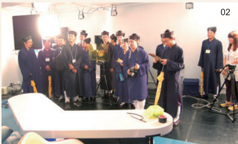
03 學員於蓬瀛仙館《道德經》 壁前合影