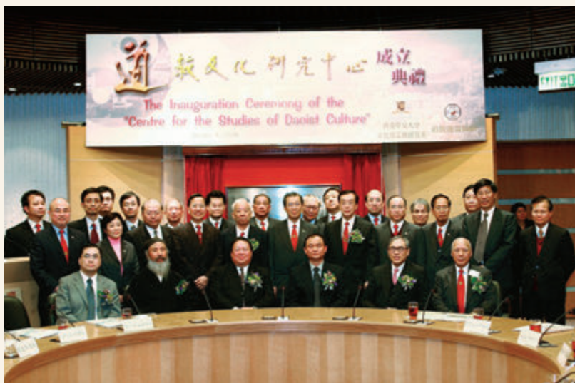
◎ 蓬瀛仙館與香港中文大學合辦道教文化研究中心

2006年，蓬瀛仙館與香港中文大學文化及宗教研究系合作成立道教文化研究中心，其目的的一方面是推動國際道教學術研究及具大學水平的道教課程；另一方面是發展道教文化的普及教育與通識教材，並加強各地道教界與香港的交流。