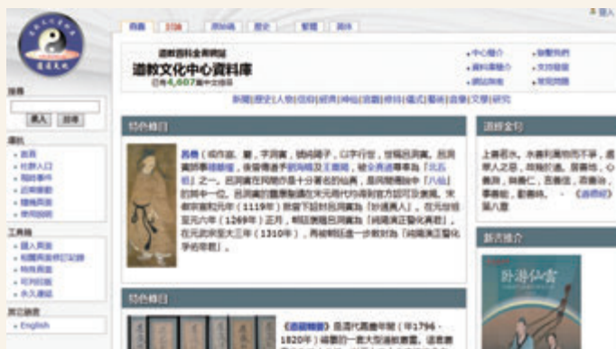
◎ 道教文化中心資料庫

1999年蓬瀛仙館建立道教文化資料庫，至2007年發展成道教文化中心。中心致力以不同形式弘揚道教文化，其中以百科全書編目方式撰寫的資料庫網站（ wiki.daoinfo.org ），兼備中英雙語，一直是互聯網上主要的道教參考資料。此外，文化中心網站（ www.daoinfo.org ）報道最新道教資訊，聯繫和促進各地道教文化的交流。