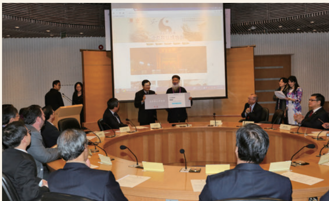
◎ 道教數位博物館啟動儀式