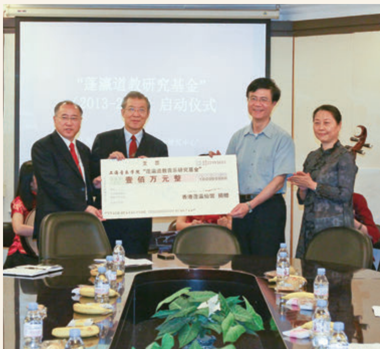
◎ 上海音樂學院蓬瀛道教音樂研究基金捐贈儀式

2008年，蓬瀛仙館與上海音樂學院中國儀式音樂研究中心合作成立「蓬瀛道教音樂研究基金」，旨在弘揚傳統道教音樂文化，以道教音樂的學術研究、人才培養以及道教音樂的傳播展示等方面為工作重點，並在2013年啟動第二期合作計劃。