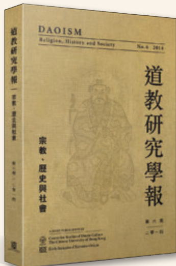
◎ 《道教研究學報》第六期(2014)