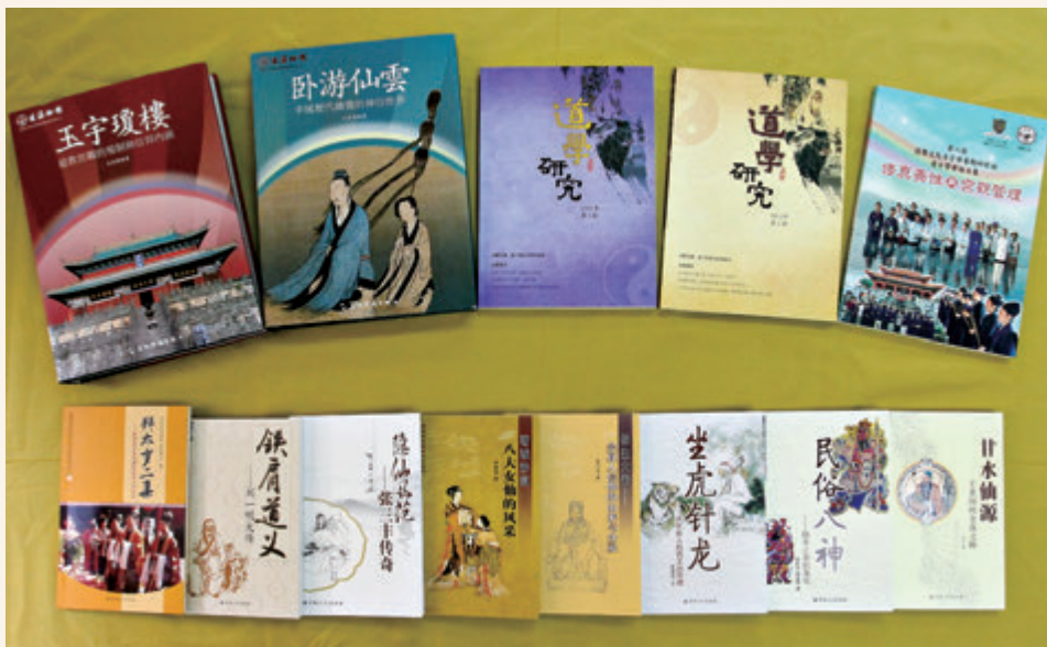
◎ 蓬瀛仙館近年出版之刊物書籍

有層次地闡述及介紹道教文化，加深人們對道教的瞭解。內容包括道教神仙、道教養生、道教善書、道教科儀、道教建築、道教藝術等等。