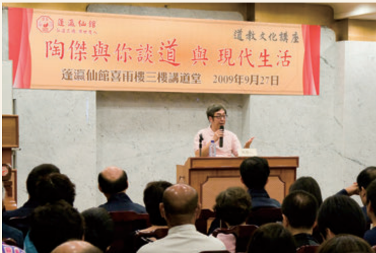
◎ 蓬瀛仙館邀請陶傑主講道教文化講座