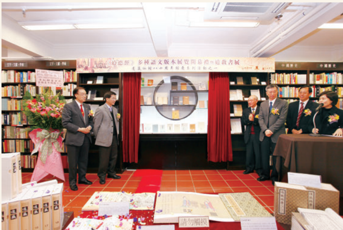
◎ 舉辦《道德經》文化展覽