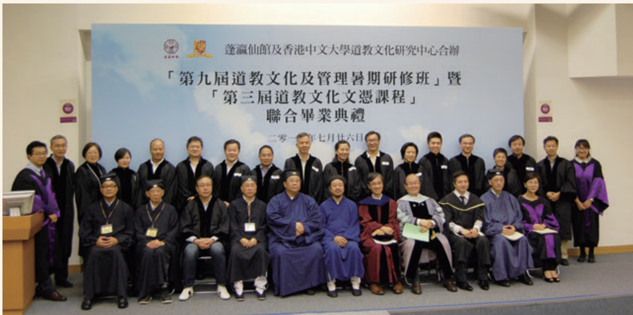
◎ 第三屆道教文化文憑課程畢業學員合影