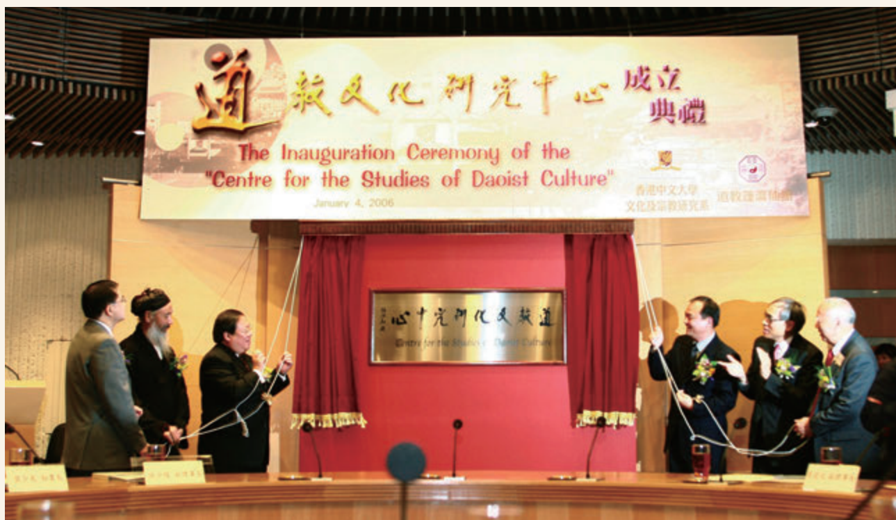
◎ 道教文化研究中心成立典禮