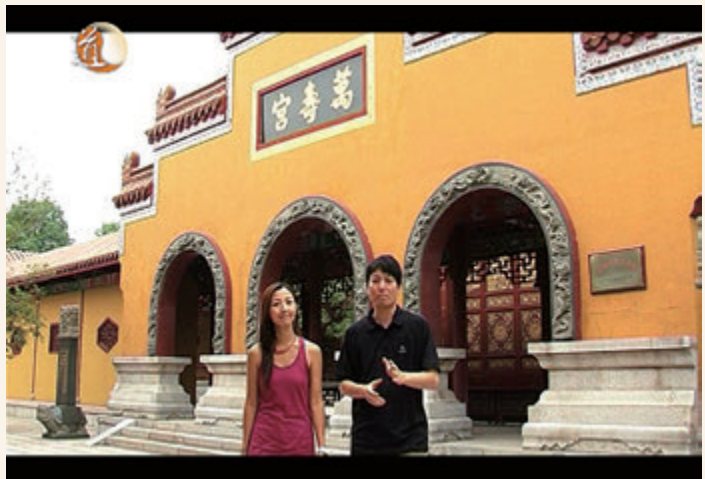
◎ 「道通天地」電視頻道節目

2004年啟播。現時在無綫網絡電視(TVBN)39台及香港寬頻(BBTV)718台24小時播放，生動、活潑及生活化地介紹道教文化，是有史以來的創舉。部份節目同時於網站(www.taoist.tv)播放，配合互聯網無遠弗屆的優勢，讓人們領略道教文化的智慧。