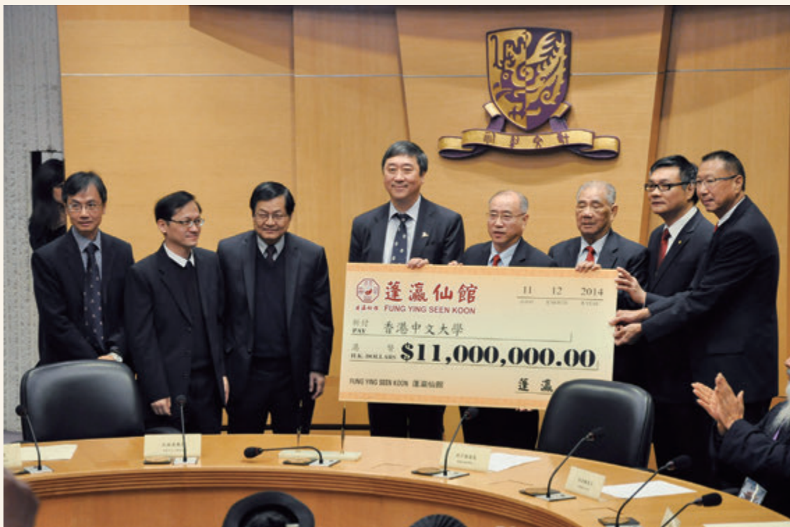
◎ 香港中文大學與蓬瀛仙館成立道教文化研究中心第三期合作協議簽約儀式