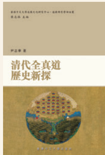
◎ 《清代全真道歷史新探》