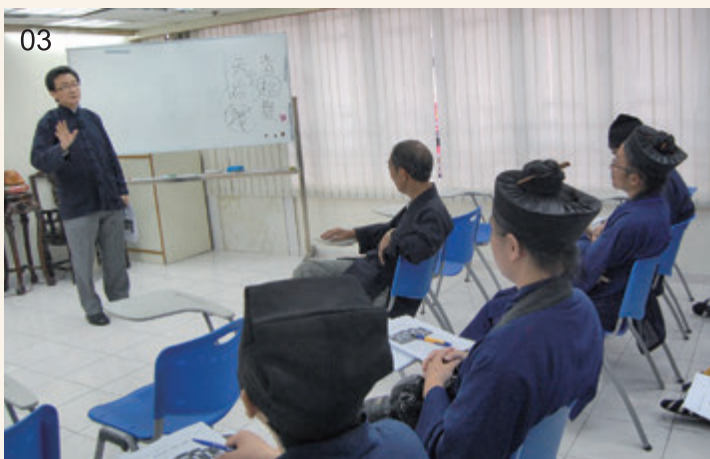
01 學員參訪香港道教聯合會