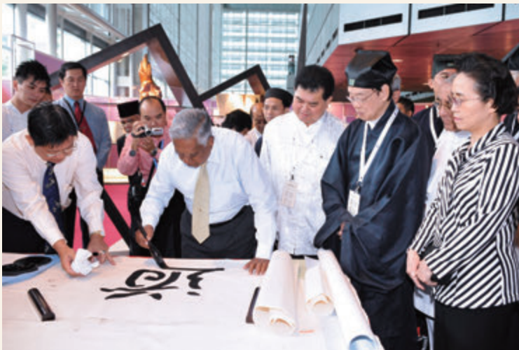
◎ 2008年9月，蓬瀛仙館與新加坡道教總會合辦「《道德經》多種語言版本文化展」。新加坡總統納丹蒞臨主持開幕儀式，並以中國書法寫下一個「道」字贈送予主辦單位。