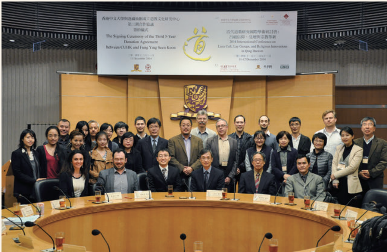
◎ 2014清代道教研究國際學術研討會：呂祖信仰、乩壇與宗教革新