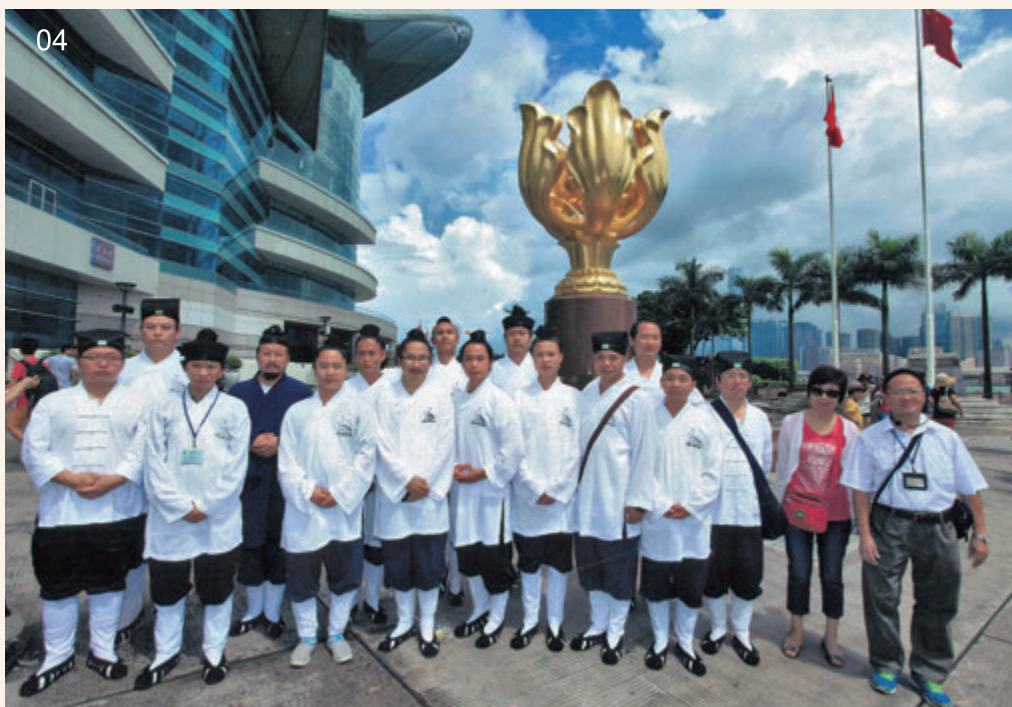
03 攝於維多利亞港海旁