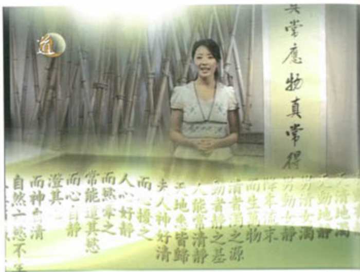
○ 「道通天地」電視頻道節目

2003年，蓬瀛仙館與香港寬頻網絡有限公司開始合作，2004年啟播。現時在香港寬頻bbTV718台及無線收費電視53台24小時播放，生動、活潑及生活化地介紹道教文化，是有史以來的創舉。部份節目同時於網站(www.taoist.tv)播放，配合互聯網無遠弗屆的優勢，讓人們領略道教文化的智慧。