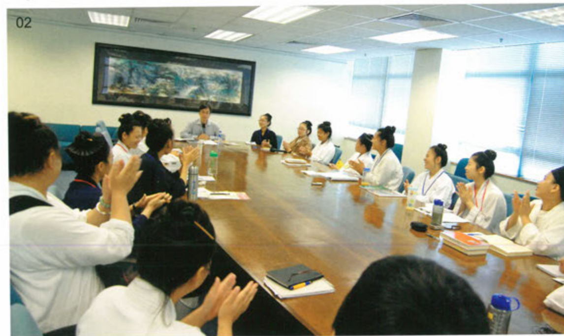
01 第一次師生專題交流會——「道教與現代社會：弘道與教育」。