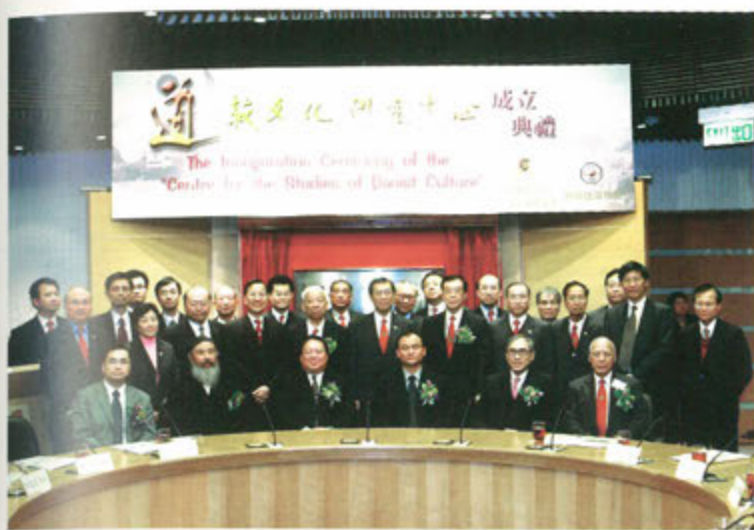
○ 蓬瀛仙館與香港中文大學合辦道教文化研究中心

2006年，蓬瀛仙館與香港中文大學文化及宗教研究系合作成立道教文化研究中心，其目的的一方面是推動國際道教學術研究及具大學水平的道教課程；另一方面是發展道教文化的普及教育與通識教材，並加強各地道教界與香港的交流。