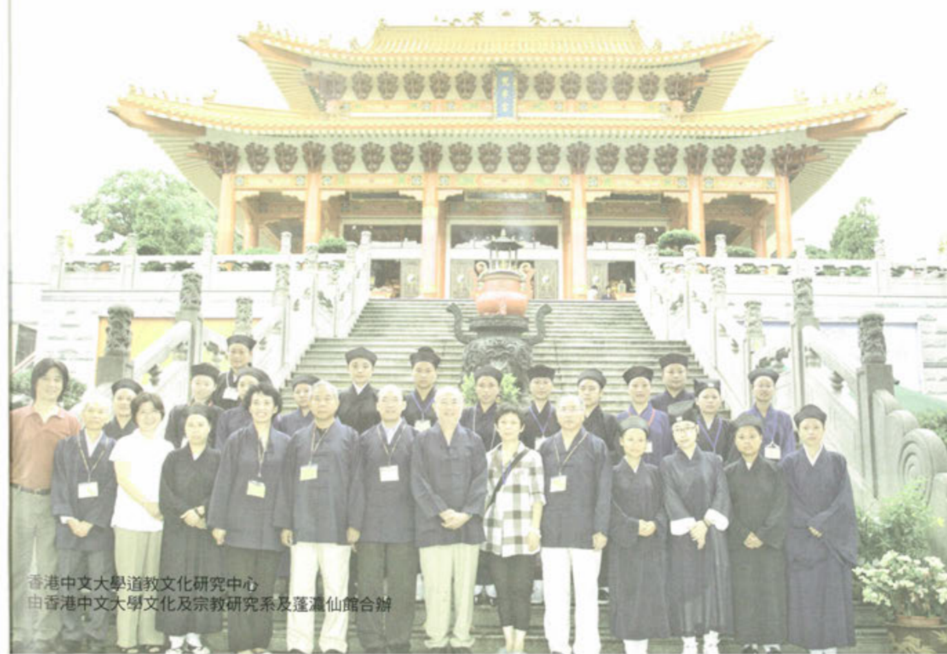
香港中文大學道教文化研究中心 由香港中文大學文化及宗教研究系及蓬瀛仙館合辦