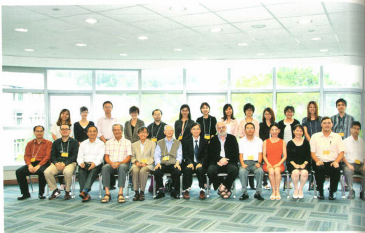
◎ 2011年宋代道教研究國際學術研討會