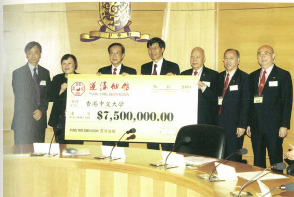
◎ 香港中文大學與蓬瀛仙館成立道教文化研究中心第二期合作協議簽約儀式