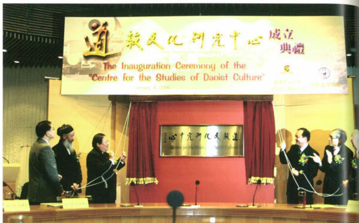
◎ 道教文化研究中心成立典禮