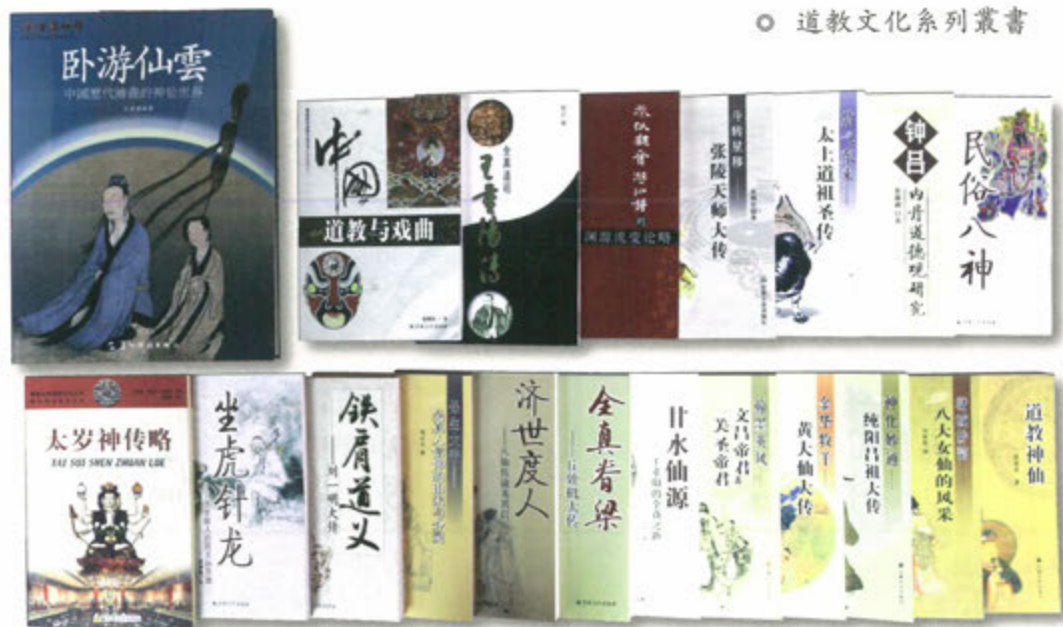
○ 道教文化系列叢書

述及介紹道教文化，加深人們對道教的瞭解。內容包括道教神仙、道教養生、道教善書、道教科儀、道教建築、道教藝術等等。