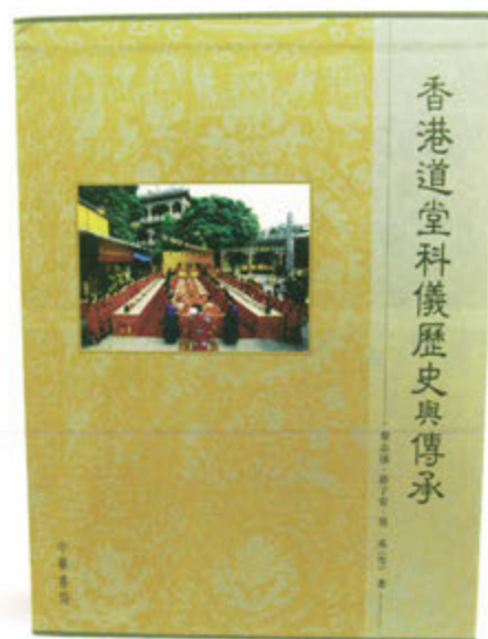
○ 《香港道堂科儀歷史與傳承》