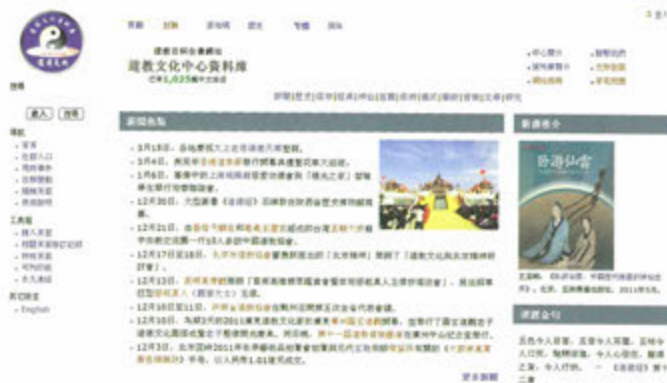
◎ 道教文化中心資料庫

1999年蓬瀛仙館建立道教文化資料庫，至2007年發展成道教文化中心。中心致力以不同形式弘揚道教文化，其中以百科全書編目方式撰寫的資料庫網站(wiki.daoinfo.org)，兼備中英雙語，一直是互聯網上主要的道教參考資料。此外，文化中心網站(www.daoinfo.org)報道最新道教資訊，聯繫和促進各地道教文化的交流。