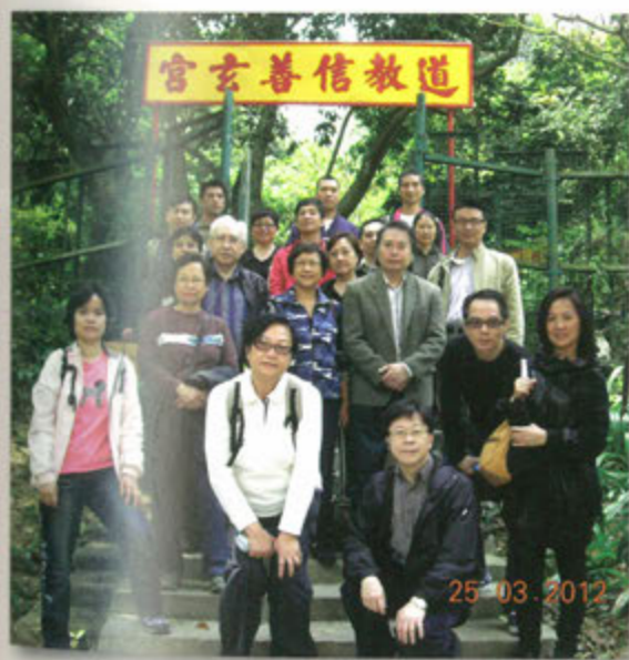
◎ 道教文化文憑課程同學參訪信善玄宮