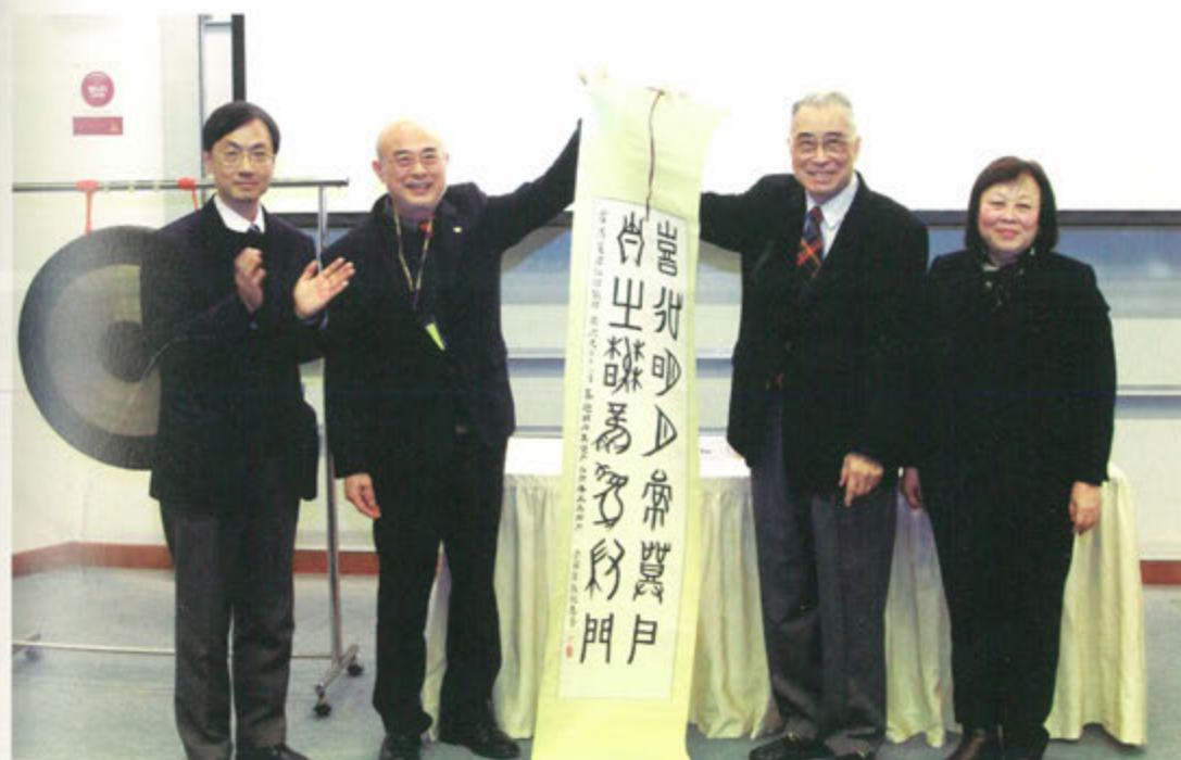
◎ 「道教文化傑出學人講座」啟動儀式