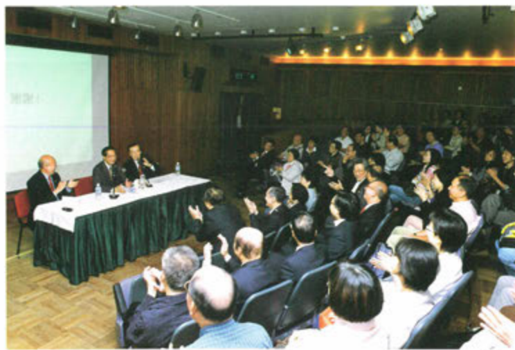
○ 蓬瀛仙館於香港大會堂舉辦的「名人講座」