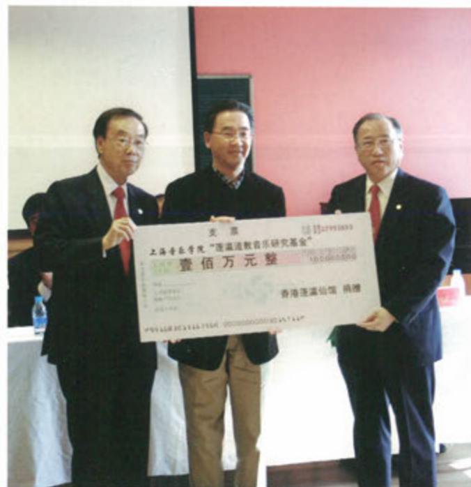
○ 上海音樂學院蓬瀛道教音樂研究基金捐贈儀式

2008年，蓬瀛仙館與上海音樂學院中國儀式音樂研究中心合作成立「蓬瀛道教音樂研究基金」，旨在弘揚傳統道教音樂文化，以道教音樂的學術研究、人才培養以及道教音樂的傳播展示等方面為工作重點。