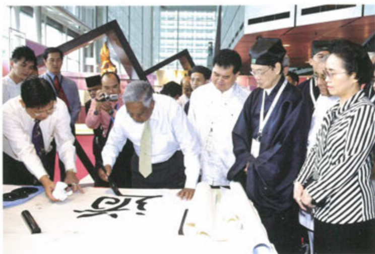
○ 2008年9月，蓬瀛仙館與新加坡道教總會合辦「《道德經》多種語言版本文化展」。新加坡總統納丹蒞臨主持開幕儀式，並以中國書法寫下一個「道」字贈送予主辦單位。