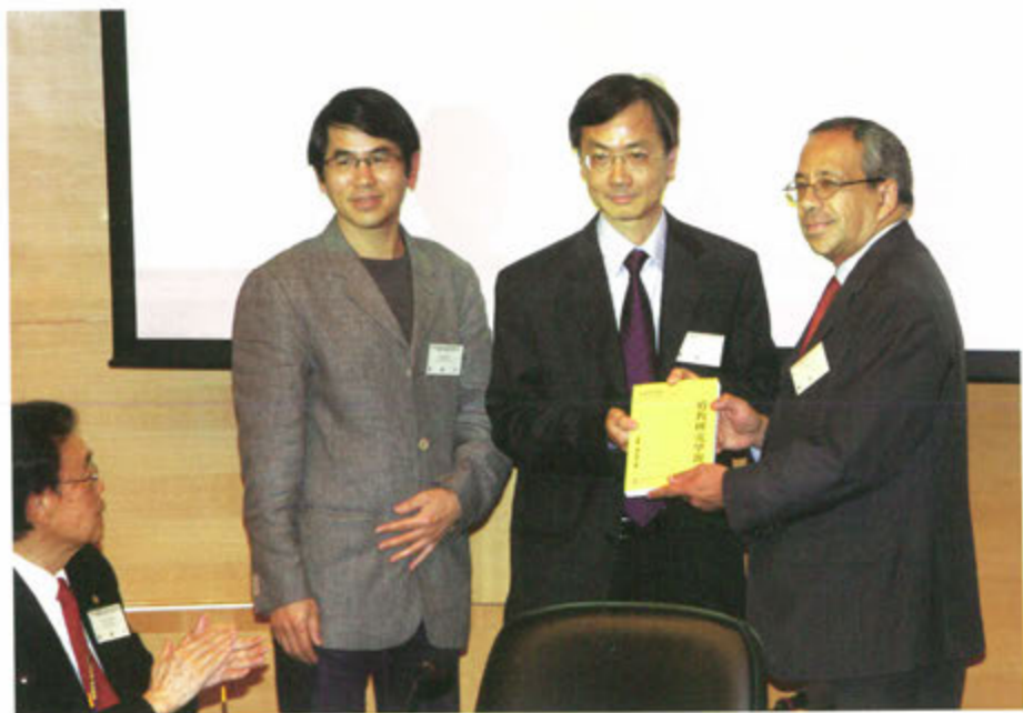
◎ 《道教研究學報：宗教、歷史與社會》創刊發佈會