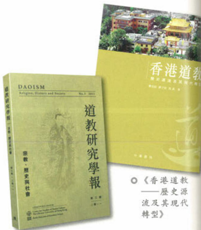
○ 《道教研究學報：宗教、歷史與社會》第三期