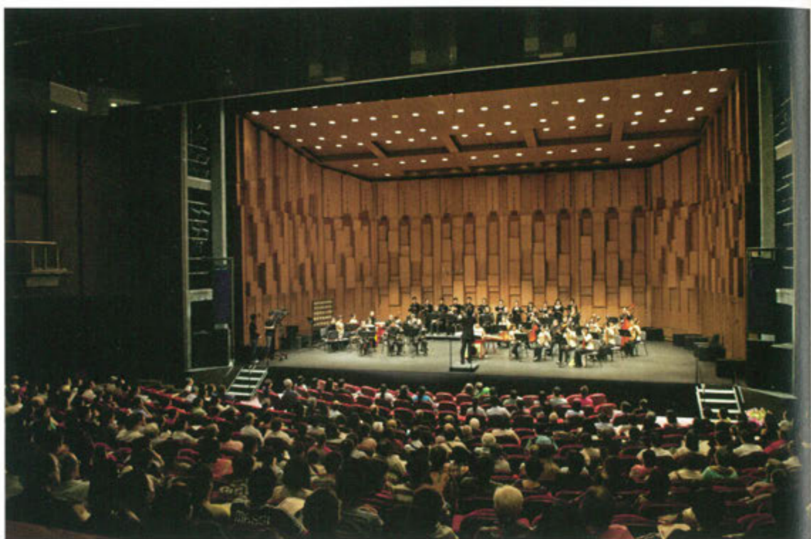
◎ 香港道樂團十五周年音樂會

1996年成立的香港道樂團，是經香港政府註冊的唯一專事道教音樂編撰和演出的團體，以廣大民眾喜聞樂見的藝術形式，作舞台觀賞演出。2001年起，道教界每年在不同的地區舉辦一次「道教音樂匯演」，香港道樂團都積極發動、參與及協助組織此項道教盛事。