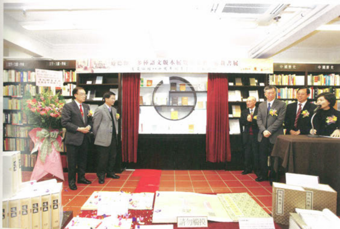
◎ 舉辦道德經文化展覽