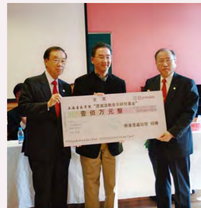
◎ 上海音樂學院蓬瀛道教音樂研究基金捐贈儀式

2008年，蓬瀛仙館與上海音樂學院中國儀式音樂研究中心合作成立「蓬瀛道教音樂研究基金」，旨在弘揚傳統道教音樂文化，以道教音樂的學術研究、人才培養以及道教音樂的傳播展示等方面為工作重點。