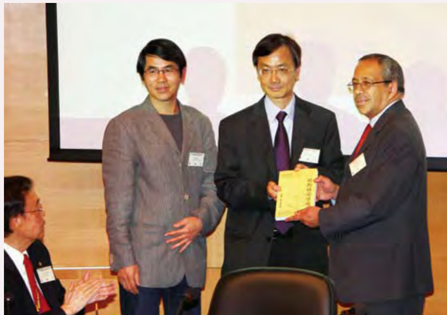
◎《道教研究學報：宗教、歷史與社會》創刊發佈會