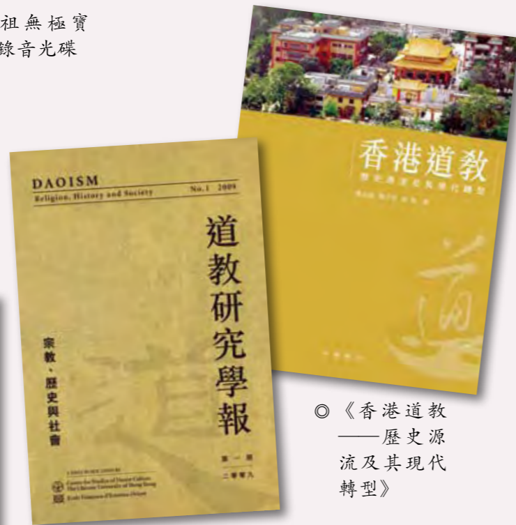
◎ 《道教研究學報：宗教、歷史與社會》創刊號