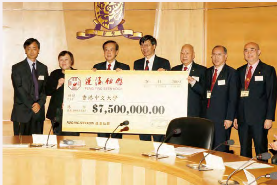
◎ 香港中文大學與蓬瀛仙館成立道教文化研究中心第二期合作協議簽約儀式