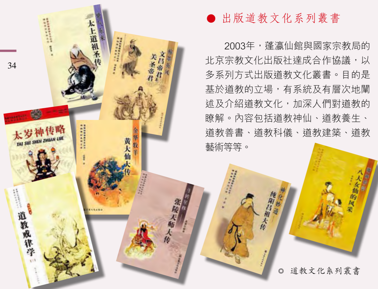
◎ 道教文化系列叢書

2003年，蓬瀛仙館與國家宗教局的北京宗教文化出版社達成合作協議，以多系列方式出版道教文化叢書。目的是基於道教的立場，有系統及有層次地闡述及介紹道教文化，加深人們對道教的瞭解。內容包括道教神仙、道教養生、道教善書、道教科儀、道教建築、道教藝術等等。