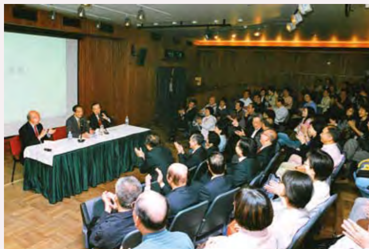
◎ 蓬瀛仙館於香港大會堂舉辦的「名人講座」