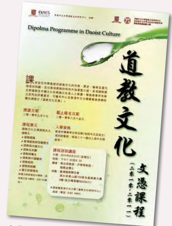
◎ 第四屆道教文憑課程