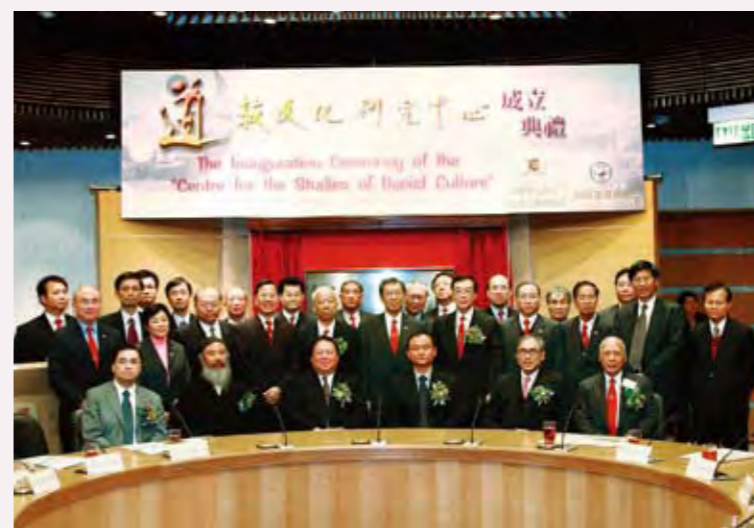
◎ 蓬瀛仙館與香港中文大學合辦道教文化研究中心

2006年，蓬瀛仙館與香港中文大學文化及宗教研究系合作成立道教文化研究中心，其目的的一方面是推動國際道教學術研究及具大學水平的道教課程；另一方面是發展道教文化的普及教育與通識教材，並加強各地道教界與香港的交流。