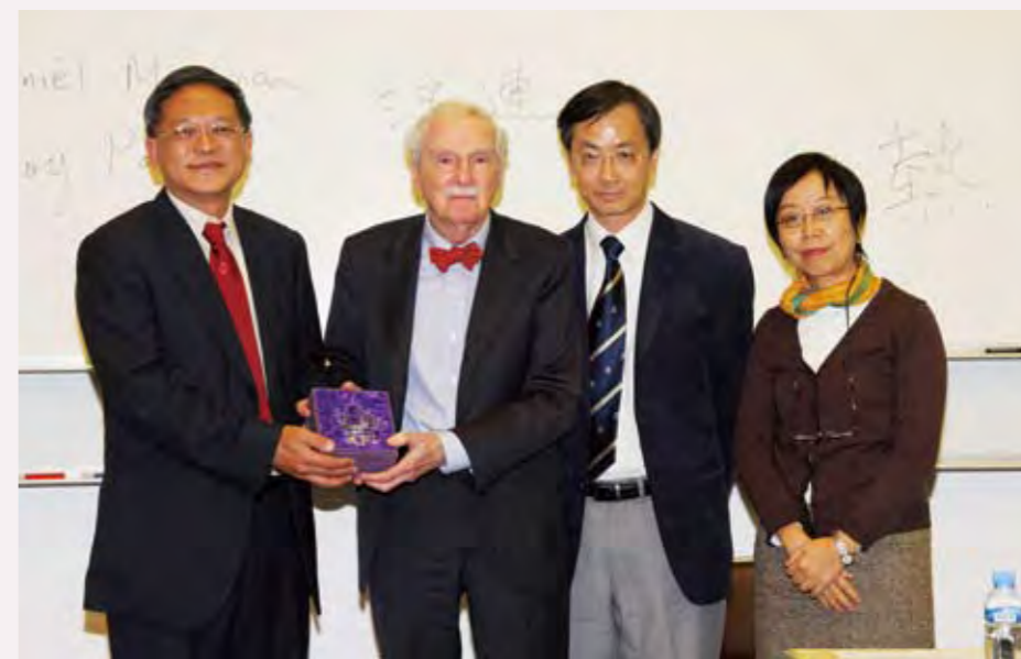
◎ 席文教授(Prof. Nathan Sivin)主講「保健、醫藥與道教」公開講座