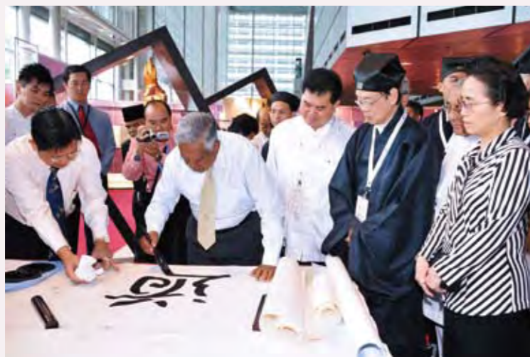
◎ 2008年9月，蓬瀛仙館與新加坡道教總會合辦「《道德經》多種語言版本文化展」。新加坡總統納丹蒞臨主持開幕儀式，並以中國書法寫下一個「道」字贈送予主辦單位。