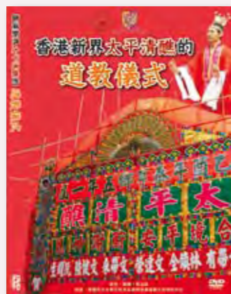
◎ 《香港新界太平清醮的道教儀式》錄像光碟