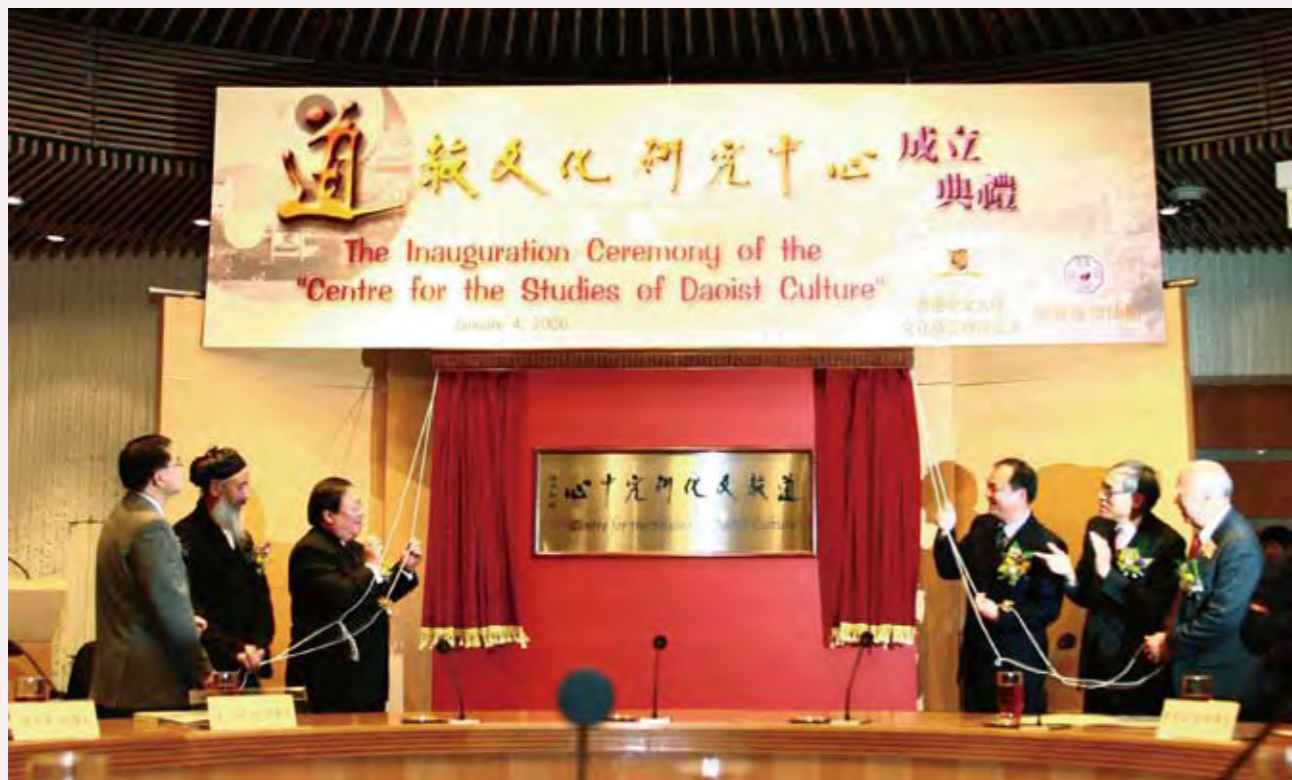
◎ 道教文化研究中心成立典禮