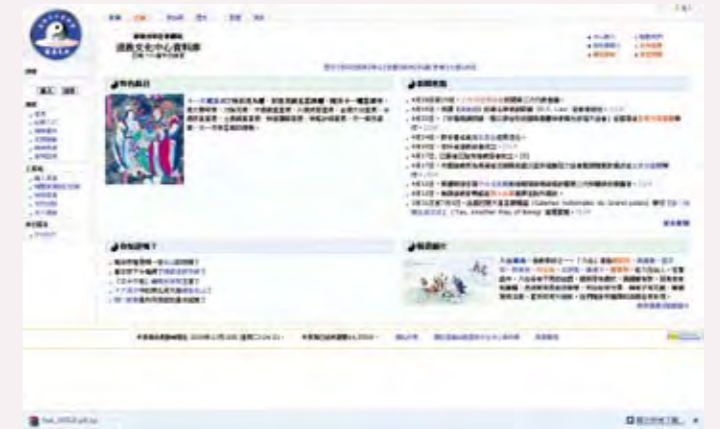
◎ 道教文化中心資料庫

1999年蓬瀛仙館建立道教文化資料庫，至2007年發展成道教文化中心。中心致力於不同形式弘揚道教文化，其中以百科全書編目方式撰寫的資料庫網站（www.taoism.org.hk），兼備中英雙語，一直是互聯網上主要的道教參考資料。此外，文化中心網站（www.daoinfo.org）報道最新道教資訊，聯繫和促進各地道教文化的交流。