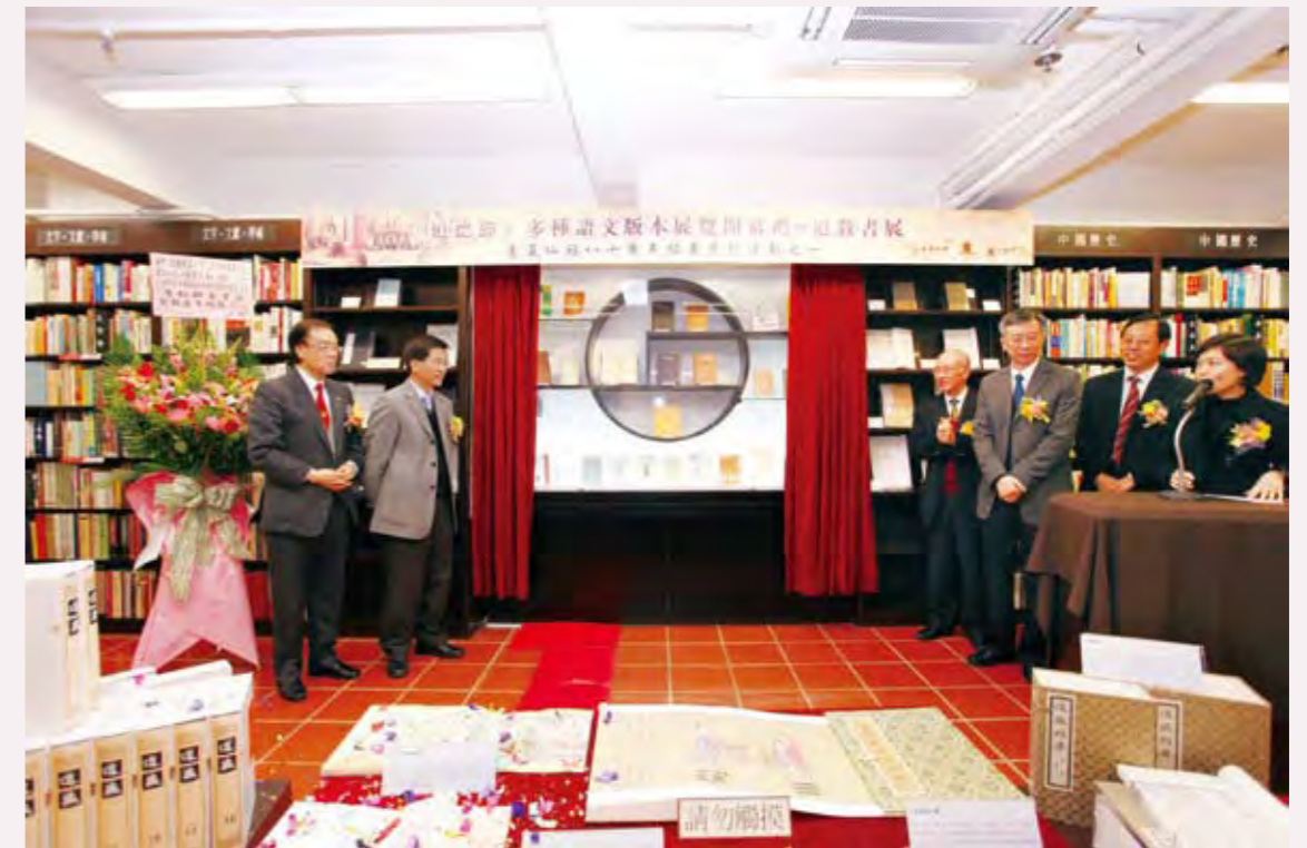
◎ 舉辦道德經文化展覽