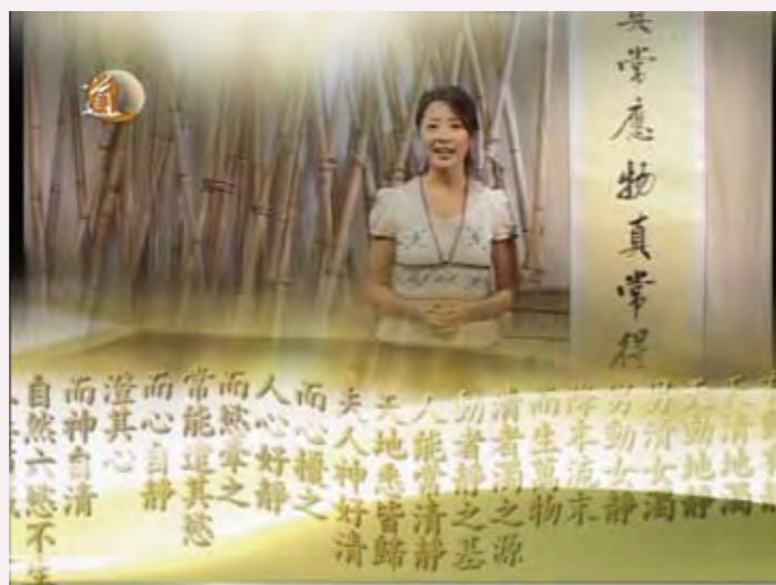
◎ 「道通天地」電視頻道節目

2003年，蓬瀛仙館與香港寬頻網絡有限公司開始合作，2004年啟播。現時在香港寬頻有線電視718台24小時播放，以生動、活潑及生活化地介紹道教文化，是有史以來的創舉。部份節目同時於網站(www.taoist.tv)播放，配合互聯網無遠弗屆的優勢，讓人們領略道教文化的智慧。