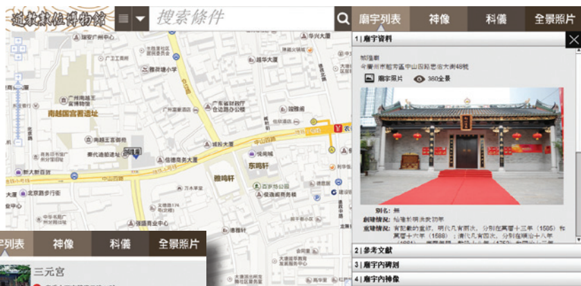
圖三：快速導航列表