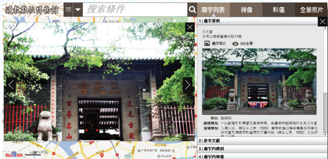
圖一：廟宇照片、神像圖片及科儀原始文稿瀏覽功能改善