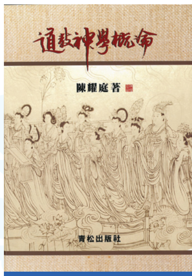
陳耀庭教授所撰《道教神學概論》封面

麼先進的啊。但是這是個神靈，他們敢講不敢講？他們不敢講。而且為什麼道教的神像都是標準像，沒有生活像，太乙救苦天尊都是正面的、坐著的，這個他們不研究的。為什麼雕塑的神像都是前傾三十度，而不能像英雄那樣直立，他們不研究的。為什麼呢？因為有三十度的前傾的話，你磕完頭擡起來，神是和藹地看著你。這些問題，是研究雕塑、美術的人不研究的，但是必須研究。不然，按照他們觀點塑出來的像是不能放在廟裏的。比如說，南昌萬壽宮塑了個許真君像，他鎮服了鄱陽湖的蛟龍，所以他們塑的像是一手拿著劍，一手拿著蛟龍的頭。旅遊局的人說要放在大殿裏供奉起來，我說這不能供奉，這是廣場雕塑，放在大殿裏面你磕頭是給許真君磕頭還是給蛟龍磕頭？這些美學問題都牽涉到有神論信仰。廣場雕塑、英雄雕塑都是正面的，頭昂起來，這是劉胡蘭、董存瑞，如果太上老君也是這樣，你磕頭是面向肚皮，而不是全身像。所以，這些都是需要探討的問題，現在作為一般文化現象來探討，是無法探討的。但是作為信仰文化必須探討，不然塑出來的像廟裏是不能用的。