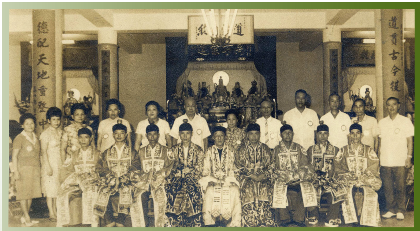
張天師於一貫道先天道院，張美良提供。

實際上，張天師是在1947年第一次踏上臺灣這塊土地。儘管從有限的資料無法確知他何時抵達？何時離開？又此行的目的是什麼？不過根據報紙的報導，可以得知最遲在10月的時候他就已經抵達臺灣，並且受聘主持臺北市大稻埕法主公廟農曆9月19日至21日（陽曆11月1日至3日）的祈安建醮。 4 為此，廟方特地於10月30日向警察機關提出建醮許可申請，也在當日立即獲得批准。 5 同月，他的行程還往南到了臺中神岡鄉圳堵村一間奉祀張天師為主神的廟宇——朝清宮，他受邀為該廟主持祝壽祈安謝恩祭典。 6 隔年，農曆正月初九日