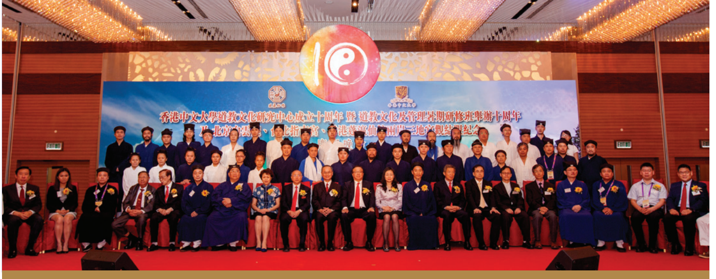
晚會主禮嘉賓與兩岸三地道教宮觀聯誼會的諸位嘉賓合影留念

自2006年開始，香港中文大學與蓬瀛仙館合作成立「道教文化研究中心」，迄今已經十年。中心自成立以來，在推動道教文化、普及道教教育、發展學術研究及人材培訓等各方面都取得了卓越的成績。為延續合作成果，雙方已於2014年底簽署第三期合作協議，在未來五年進一步推動道教研究和教學。從2006年起，香港中文大學道教文化研究中心就開始為國內宮觀道士在中大校園舉辦道教文化與管理暑期研修班，為學員們提供了一個學習道教管理和傳播的機會。至今年七月，道教文化與管理暑期研修班已經培養了十屆、超過兩百名的優秀道士學員。要切實推動道教發展、弘揚道教文化，不僅僅需要大學研究機構和宮觀之間的合作，更需要各地宮觀齊心協力、共襄盛舉。2008年，北京白雲觀、台北指南宮以及香港蓬瀛仙館聯合發起兩岸三地道教宮觀聯誼會，旨在團結兩岸三地道教界，以期共同發展、相互促進。多年來，三宮觀每年定期舉行聯誼，並在多省市修建希望學校，幫扶貧困學子；助殘濟困，修橋鋪路；支持幫助多個貧困宮觀建設，滿足信教群眾的宗教需求，彰顯了道教濟世利人、互幫互助的優良傳統。三所宮觀決定結盟以進一步加強兩岸三地的道觀文化交流和聯誼合作、促進兩岸三地和平發展，實為道教界之幸事。