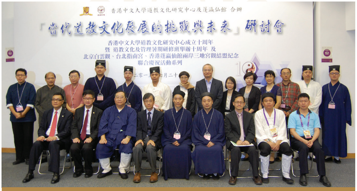
「當代道教文化發展的挑戰與未來」研討會主禮嘉賓及演講嘉賓合影

為慶祝香港蓬瀛仙館、北京白雲觀、台北指南宮兩岸三地宮觀結盟，以及慶祝蓬瀛仙館與香港中文大學合作成立的香港中文大學道教文化研究中心成立十周年及中心主辦的「道教文化及管理暑期研修班」舉辦十周年，同時總結十年來暑期研修班的辦學經驗，本中心於2015年7月25日假香港中文大學利黃瑤壁樓演講廳舉辦了「當代道教文化發展的挑戰與未來」研討會。本次研討會以「當代道教文化發展的挑戰與未來」為主題，集中探討四個分題：道教青年領袖的栽培及使命承擔、道教經典的現代詮闡及傳播方式的再思考、道教文化推廣與道教的全球化、道觀信仰生活及體制的轉變與革新，目標