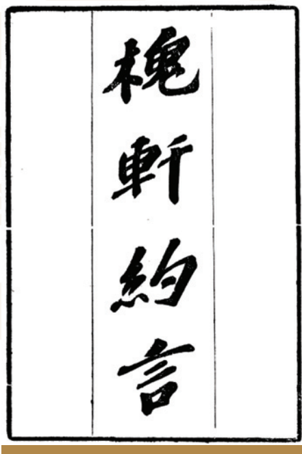
民國扶經堂《槐軒約言》

劉門《性命微言》中的修行方法不似道教丹家樂於顯言，然考其修行理論、思想，劉沅則不厭其煩地論述。《子問》、《又問》、《拾余四種》、《槐軒約言》等都是談論儒道佛三家的書。其中以《槐軒約言》最為精要，能總括劉沅的學術、修道體系。據〈約言自記〉所敘，嘉慶九年甲子，劉沅從野雲老人學成，開始正式傳授《性命微言》和道教內丹功時，門人將其語錄編成《