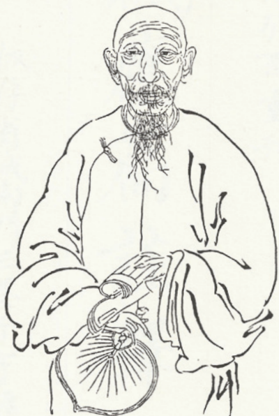
劉沅八十八歲肖像圖