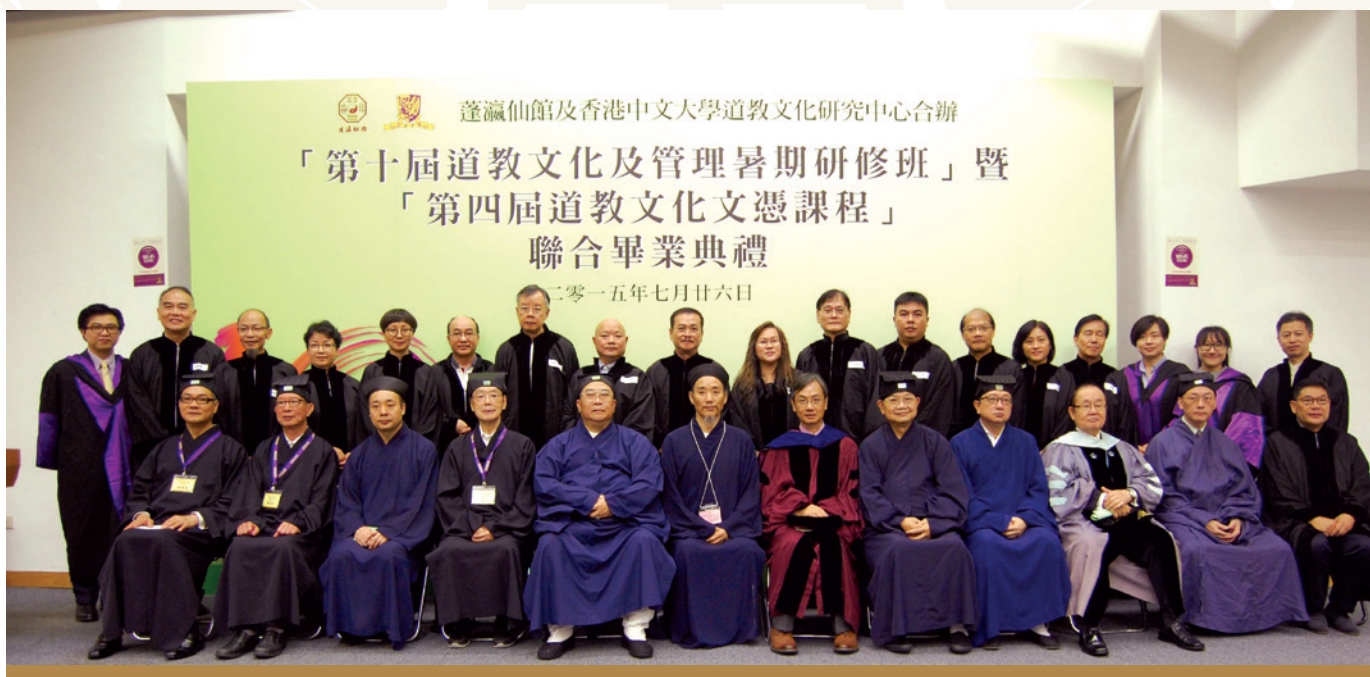
第四屆道教文化文憑課程畢業學員合影

「第十屆道教文化及管理暑期研修班暨第四屆道教文化文憑課程聯合畢業典禮」於本年7月26日於香港中文大學利黃瑤壁樓舉行，典禮邀得中國道教協會副會長孟至嶺道長、香港道教聯合會主席梁德華道長等作為主禮嘉賓。本年共有20位研修班學員及16位文憑課程學員完成課程，學員們分別從主禮嘉賓、各位導師和高道大德手中領受證書，場面盛大。