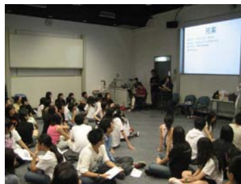
「人性實驗室」工作坊以「協助行為 (helping behaviour)」作主題