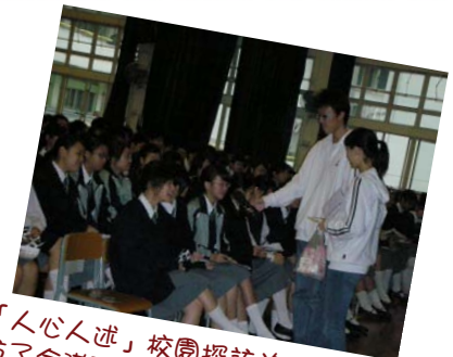
「人心人述」校園探訪於三至四月走訪了全港到多間中學進行短講