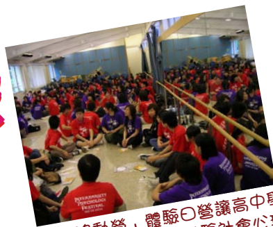
「心理移動營」體驗日營讓高中學生在香港中文大學校園體驗社會心理學

三大心理學節 (Intervarsity Psychology Festival) 簡稱 Psy Fest，指的是由香港大學心理學學會、香港中文大學心理學推廣學會及香港城市大學心理學系之同學聯手策劃及推行的一系列活動。旨於向大眾推廣心理學知識及糾正廣大市民對心理學的誤解。而本年Psyfest以「社會心理學」作為主題舉辦了三個大型活動，對象均為全港中學生：