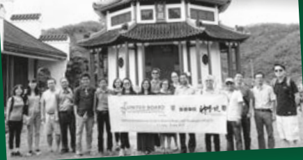
學者們於七月六日一起到道風山基督教叢林參觀。