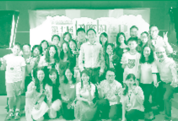
第七屆青年研討會