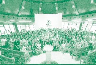
聖樂與崇拜研討營2017