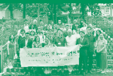
亞洲文化與神學 高級研修班(IASACT)