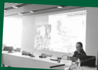
每位學者也需要進行約一小時的口頭匯報，講解他正在研修的學術文章。