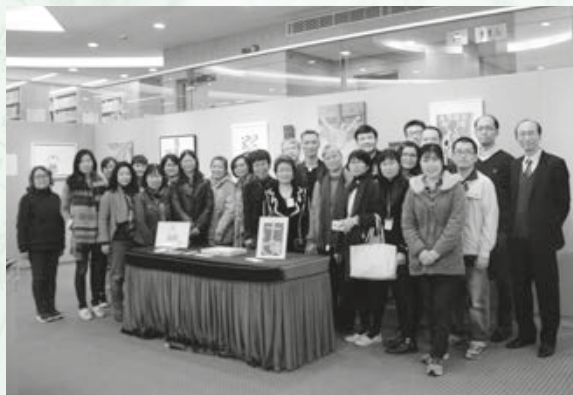
2017年3月8日再現上主的形象展覽的開幕典禮暨研討會的眾嘉賓和同學的大合照

最後，要注意的是，上述我提到的神學教育理念的主角和主導者應該是我們所珍愛的學生們。配合現在強調目標為本的學習（Purpose Learning），學生主導才是載體神學教育法的核心要素。因此，我在文章的終結時，分享我的載體故事。我還記得我與一群攬劇場教育的朋友聚會，大家決定用一個身體塑像去表達自己對教育的想法。我伸出我的左右手的拳頭，上下連在一起。我說我理想的教育就是學生自主、自發尋問生命的智慧，廣東話俗語是「揸石仔」！事實上，這也是我在崇基學習中所經歷的快樂（當然也包括痛苦和需要極大忍耐的尋問和拆毀過程）。因此，我也如此期望在崇基神學教育下的學生，經歷不是「堅離地」，而是「落地」踐行的自主學習旅程。祝君旅途愉快！