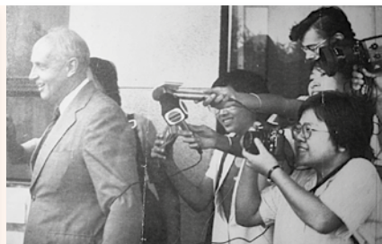
1983年7月，她在北京機場採訪，左為前港督尤德。