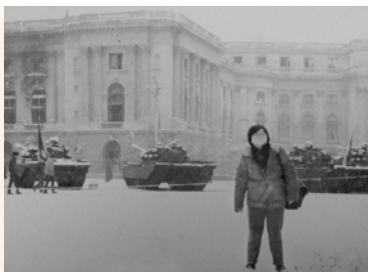
1989年12月在羅馬尼亞採訪