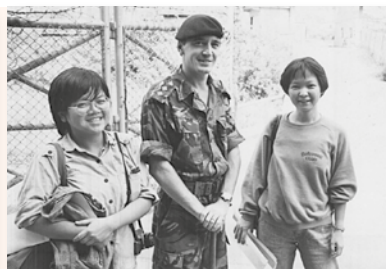
八十年代在邊境的採訪照