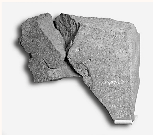
圖：藏於以色列博物館內的但丘石碑，白色部分為詞元 bytdwd ，其中的一個解讀為「大衛王朝」。

但丘碑文中的詞元 bytdwd 被認為是對大衛史實性挑戰的一大反擊，實際上這只是海市蜃樓。由於缺乏石碑豎立的背景資料及碑文充滿空隙和模糊性，重構文本的過程需要建基於大量假設和猜測。儘管原版的重構方法有利於將 bytdwd 解讀為「大衛王朝」，但丘碑文也無法為大衛的史實性提供有力的證據。除了「大衛王朝/王室/家族」，詞元 bytdwd 還可以被解讀成「多德神殿」、「『親愛的』神殿」、某地方名，及耶路撒冷的別名。雖然從公元前九世紀的語境看，「大衛王朝」仍是最合理的解讀，此解讀也無法合理地建立大衛的史實性。大衛有可能是歷史人物，也有可能是虛構性的王朝或民族始祖。假如大衛真是一個公元前十一世紀後期至十世紀前期的歷史人物，他極其量也只是一個酋長。但是，此論說也是建基於大衛史實性的假設上，並有待新的考古證據支持或推翻。但丘碑文唯一能夠合理地支持的是以大衛為王朝創始人的傳統早於公元前九世紀已經存在。