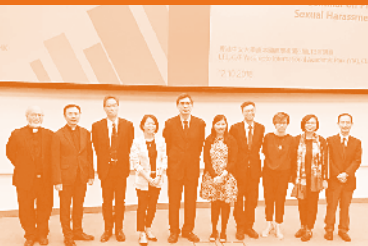
「不叫我們遇見試探——預防及處理教會內的性騷擾」研討會