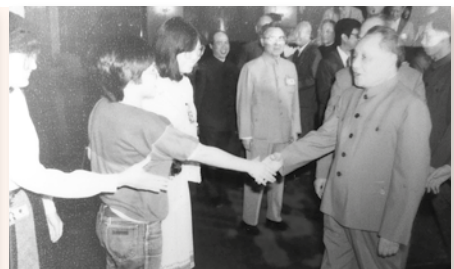
在北京採訪時獲鄧小平接見