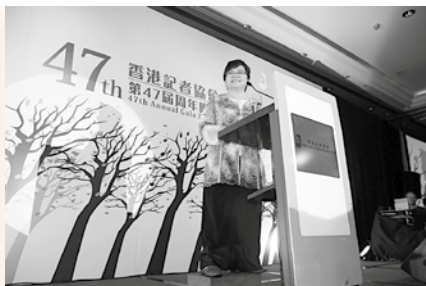
香港記者協會於2015年5月舉行的周年晚會