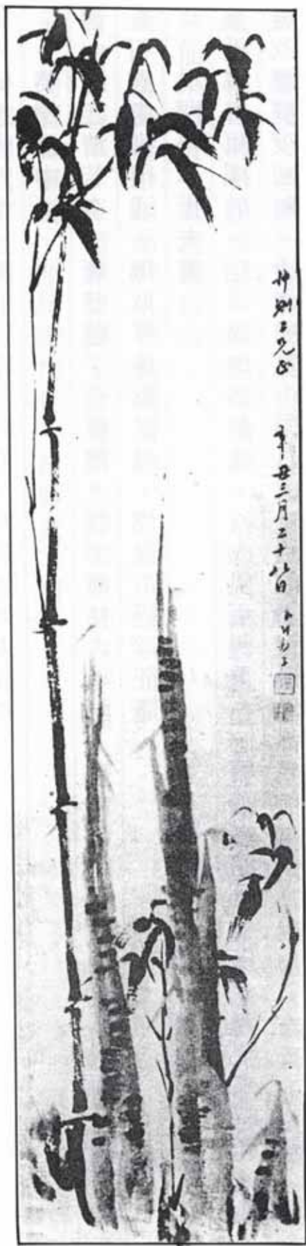
張錦芳爲黃景仁畫竹枝圖軸