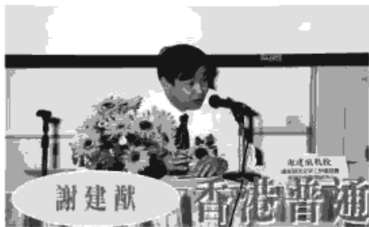
國家語委普通話培訓測試中心教研處處長 香港中文大學普通話教育研究及發展中心訪問教授