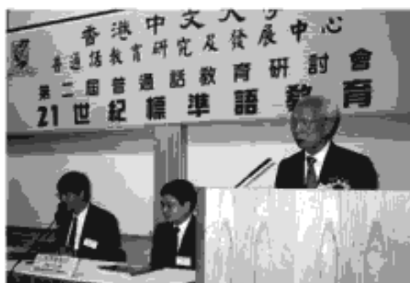
田家炳先生擔任研討會主禮嘉賓

本中心於5月28日、29日，舉辦了第二屆普通話教育研討會。近450位本港及內地學者、教育界人士參加。這次研討會的主題是“21世紀標準語教育”，