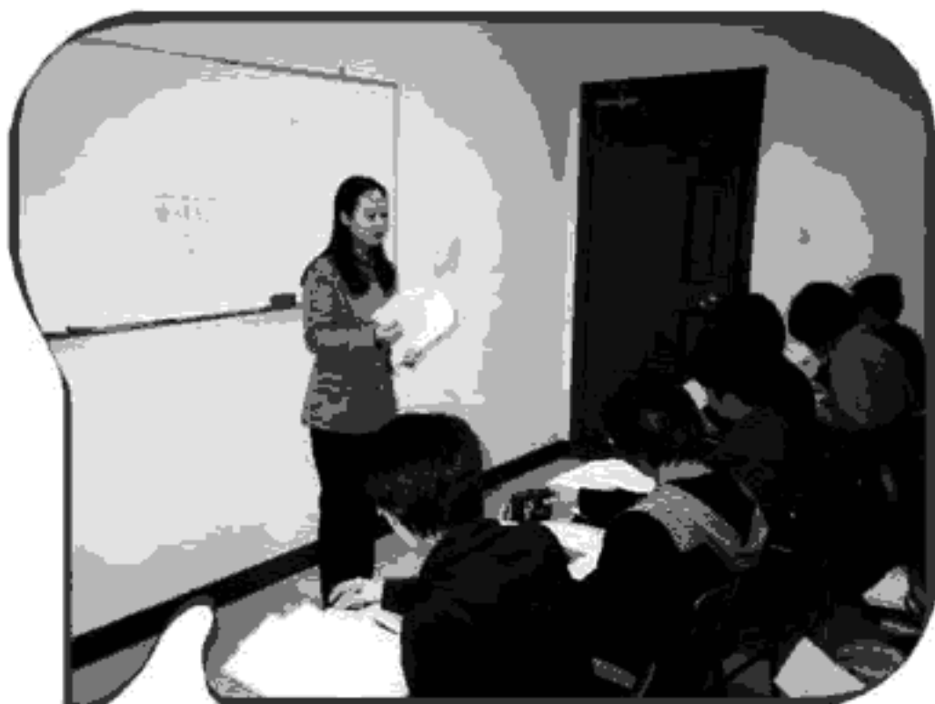
宜力女士給“普通話水平測試強化訓練課程”的學員講解發音道理

施仲謀（1997）。〈中小學生、成人、外國人普通話教學法〉。載施仲謀、林建平、謝雪梅合編《普通話教學理論與實踐》。香港：廣角鏡出版社有限公司。