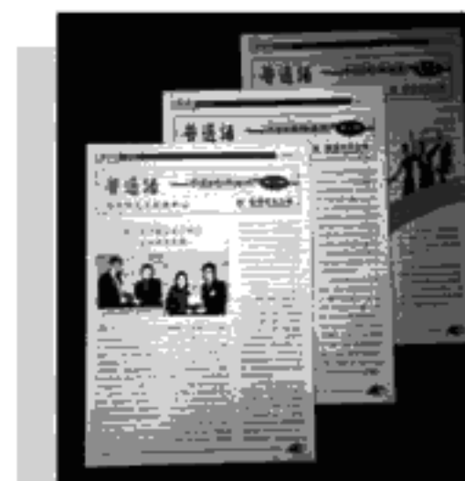
辦好通訊,推陳出新

從上表資料可見,老師們對本刊提了寶貴的意見。有些老師認為本刊較少談中、小學普通話科教學的文章。為此,本中心三位導師率先寫了三篇稿子,從小孩兒學習普通話談到中學生學習漢語拼音的竅門,跟老師們交流研討,拋磚引玉,希望老師們踴躍投稿,在本刊發表諸位的真知灼見,教研心得,或者談談教學體會。來稿刊登後,當致送當期《通訊》10份以表心意。推普是大家的事,大家的事大家做。