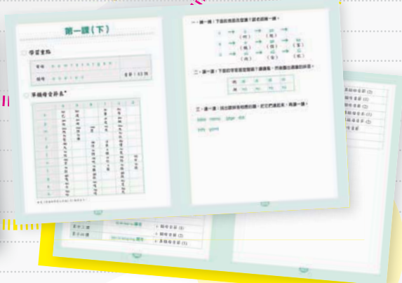
拼音練習冊《活用拼音課業》(單獨購買)