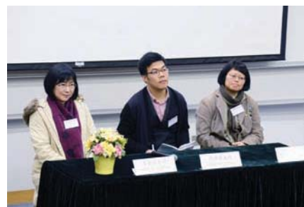
★普通話教育論壇答問環節