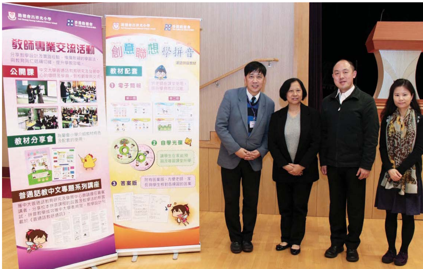
★出席小學分享會留影