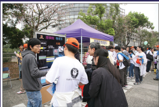
★ 於終點，物理系師生正在講解簡單的激光實驗