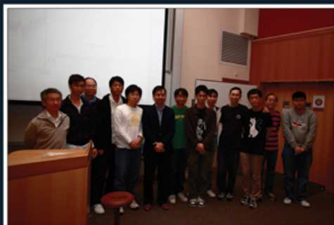
★主辦單位與講者合照