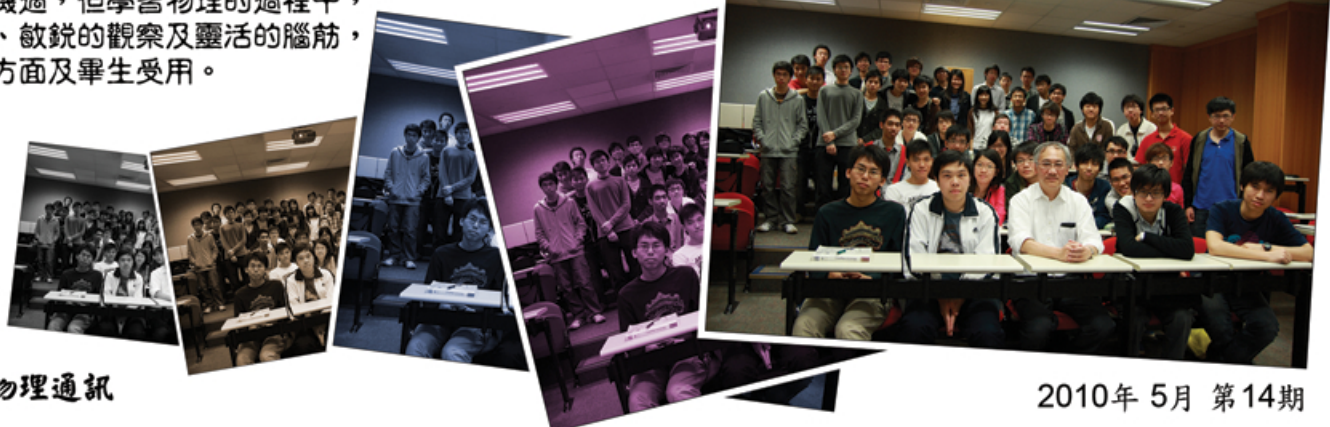
★ 廖教授與修讀電磁學的同學合照★

雖然不知道廖教授何時再來授課，不過他仍然關心香港學生於物理學上的發展及機遇，訪問期間也詢問筆者有關物理學生的出路。他寄語中大物理生及校友們，未來的路能否與物理有關需要機遇，但學習物理的過程中，邏輯的訓練、敏銳的觀察及靈活的腦筋，卻能用於多方面及畢生受用。