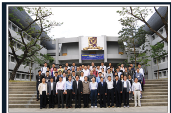
★ 25位國際傑出科學家在研討會後的大合照

本系及中大理論物理研究所於4月30日至5月3日舉辦了以光學和新材料為主題的研討會。是次會議是2008年底所舉辦的「光學與新材料研討會」的延續編。25位來自中國大陸(包括3位中科院院士)及歐、美等地的傑出科學家於研討會中作了邀請報告,探討當前國際學術界在光學和光學新材料的最新發展。研討會亦安排了張貼報告,讓與會學者發表和交流他們的研究工作。