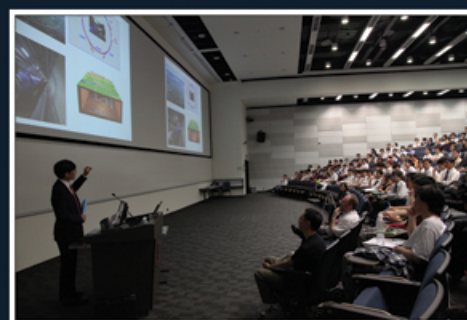
★中大物理系講座教授楊綱凱教授介紹CERN的實驗背景