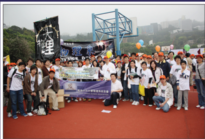
★ 中大物理系於起點出發！

http://www2.cuhk.edu.hk/oi/a/cht/gi/vi/ng/i/ndex.php?type_id=3&E0_id=82