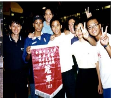
右：1999 年帶領物理系泳隊於新亞水運會取得男子組冠軍

唸物理，讓我有機會接觸物理學上的不同範疇，大至天文字宙學，小至量子力學，也讓我看到物理學研究上的廣泛性。我很喜歡運動，渴望能做一些與運動有關，又易於觀察及觸摸到的力學研究。因此畢業後便到體育運動科學系當研究助理及攻讀碩士，跟洪友廉教授學習分析運動動作及關節力學的技術。洪教授出身於清華大學物理系，因為喜歡運動而從事運動力學研究，現已貴為國際運動生物力學學會會長。