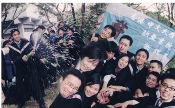
2000 年與新亞物理系的同學畢業照

唸物理，讓我有機會接觸物理學上的不同範疇，大至天文字宙學，小至量子力學，也讓我看到物理學研究上的廣泛性。我很喜歡運動，渴望能做一些與運動有關，又易於觀察及觸摸到的力學研究。因此畢業後便到體育運動科學系當研究助理及攻讀碩士，跟洪友廉教授學習分析運動動作及關節力學的技術。洪教授出身於清華大學物理系，因為喜歡運動而從事運動力學研究，現已貴為國際運動生物力學學會會長。