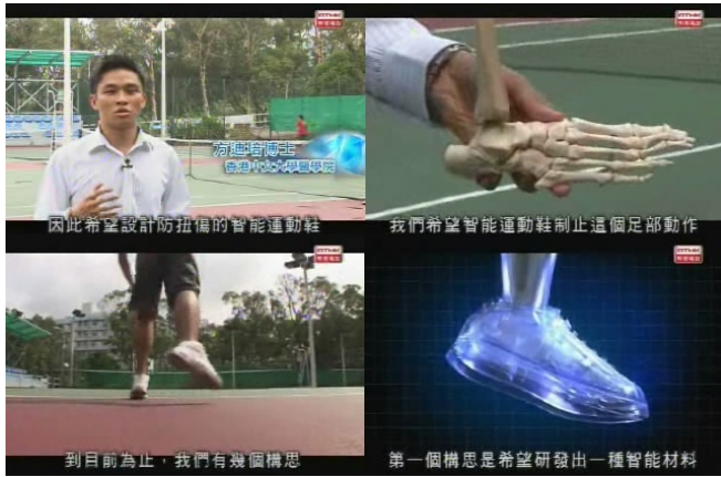
左：於香港電台節目<<創新戰隊>>中講解防止踝關節扭傷運動鞋的研究

在世界各地，人體運動生物力學這門專科常常是跨學院的（醫學院、理學院和工程學院），當時的我選擇留在中大醫學院繼續進修，主要考慮到這門專科對醫學的貢獻－運動創傷是由力的失衡造成，所以運動力學的研究應當可以有助找出運動創傷的原因和機制，或能評估手術治療後的運動表現和生物力學，更能有助設計預防創傷的裝置，直接地幫助運動員。