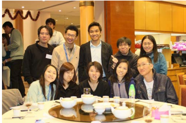
右：最近與其他校友於校友會聚餐合照

我的博士研究課題是設計一雙防止踝關節扭傷的運動鞋，當中運用了汽車安全氣囊的概念－“先有感應器去感應外在磁力，然後辨悉意外，最後啟動充氣氣囊，以保護司機和乘客”。我嘗試將此概念套在運動鞋上，先把壓力和動作的傳感器放在鞋身，從而推算及監測足踝的活動和扭力，透過收集得來的數據進行分析，並制定數學方式來辨認足踝扭傷的危機。最後便是設計保護的方法，當中包括使用智能材料、紡織技術和電刺激的技术以達到護踝的目的。這個課題從 2006 年開始已得到香港特別行政區政府創新科技署資助，合作單位包括體育運動科學系，機械與自動化工程學系，理工大學醫療科技及資訊學系，及位於香港科學園的合作夥伴。上年 11 月，香港電台的<<創新戰隊>>節目也簡單介紹了這項研究題目。