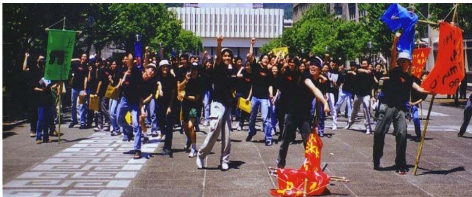
左：1998 年以大組長身份參與物理系迎新營

當我還是本科生時，曾當過迎新營大組長、新亞泳隊隊長及大學游泳隊副隊長。活躍於學生活動之餘，仍不忘對物理的喜愛，並早已立志畢業後要繼續攻讀與物理研究有關的碩士及博士課程。