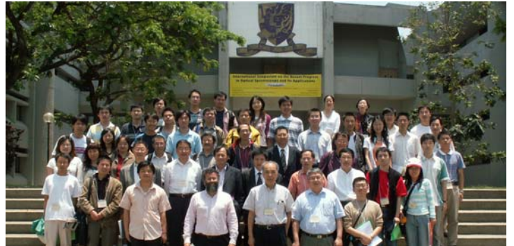
「光譜學及其應用最新進展國際研討會」參加者合照

由利希慎基金贊助，光學研究中心及物理系舉辦的「光譜學及其應用最新進展國際研討會」已於2007年5月7日至9日舉行。18位來自中國及歐美等地的傑出物理學家於研討會中作了邀請報告。不同領域的科學家於研討會中討論了光譜學及其應用的最新進展，藉以尋找解決當代物理學和生物學中共同感興趣的問題的方法；學者們亦就光譜學的未來發展彼此交換了意見，分享經驗和知識。