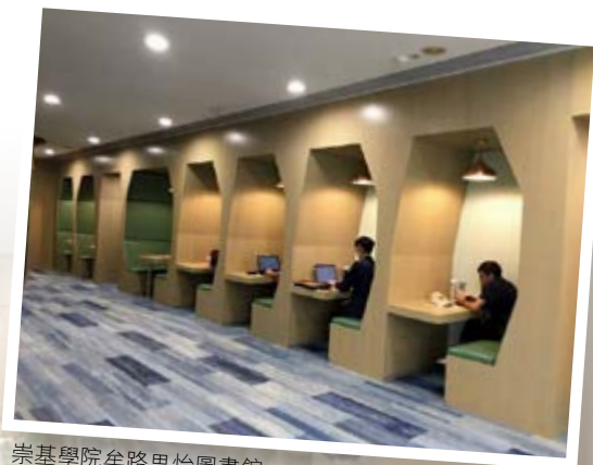
崇基學院牟路思怡圖書館

為慶祝這項翻新計劃順利完成，10 月 24 日舉行了答謝會，一眾主禮嘉賓主持二樓重開儀式。全新的崇基學院圖書館，與研究型大學互相匹配，我們為此而很高興。歡迎來下校園參觀！