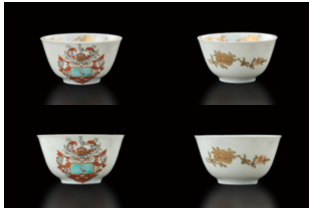
粉彩西洋紋章小杯 清代 (18世紀) 文物館館友會惠贈 香港中文大學文物館藏品 (編號1996.0332)