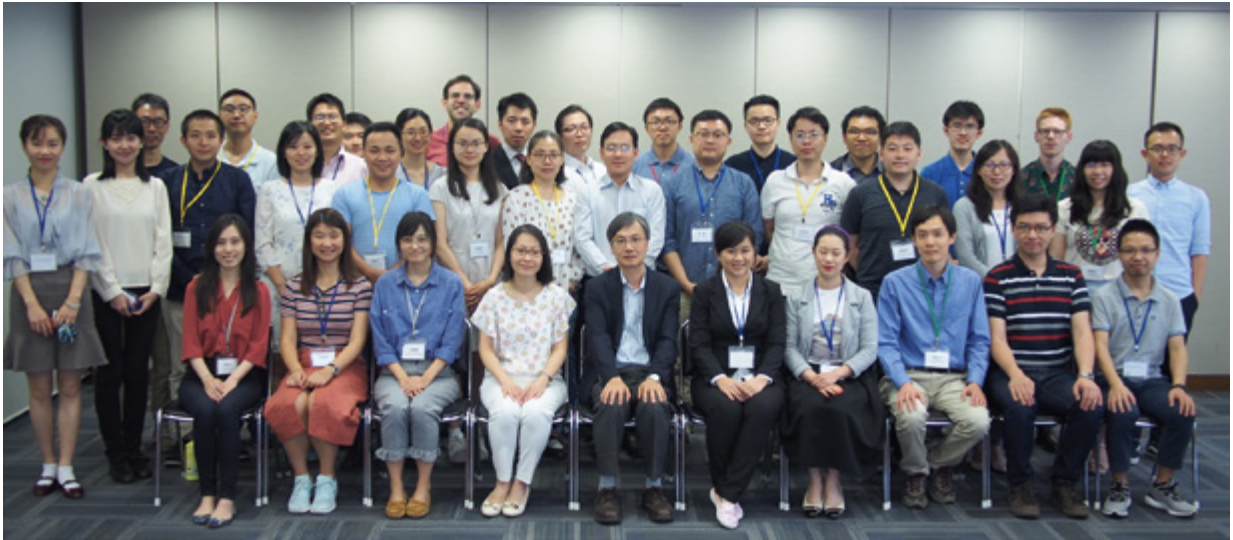
Young Scholars' Forum in Chinese Studies 2018 第五屆中國文化研究青年學者論壇