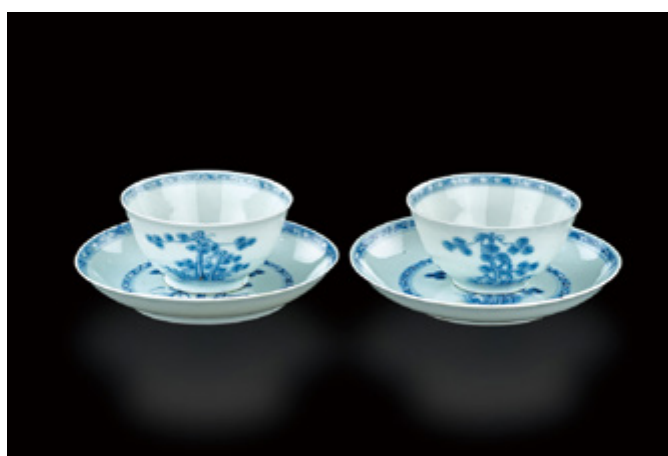
青花松樹紋杯一對連托碟