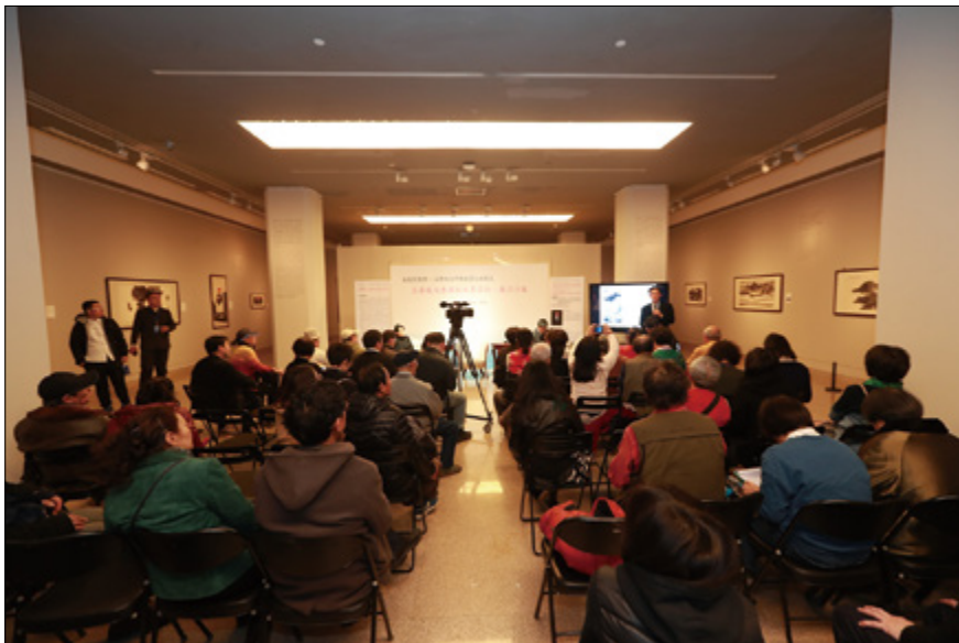
中大文物館館長姚進莊教授 介紹呂壽琨的藝術