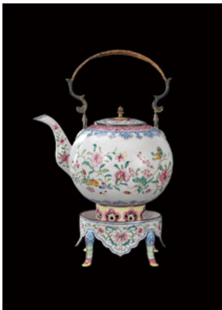
廣東銅胎琺瑯花卉紋提梁壺連獸足爐一套