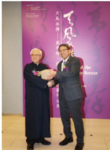
歐豪年教授與段崇智教授