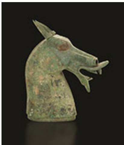
青銅馬頭 東漢·二世紀 承訓堂藏