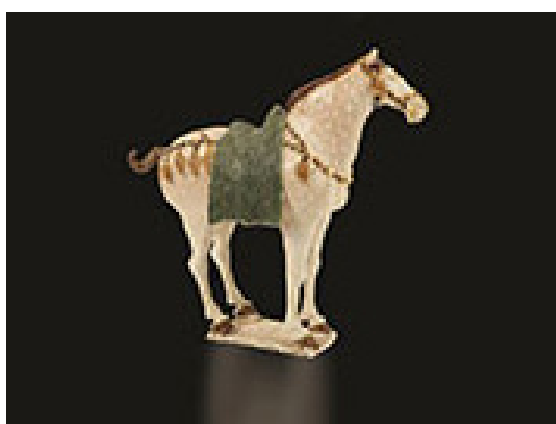
三彩鞍馬 唐·八世紀上半葉 胡家麟先生藏