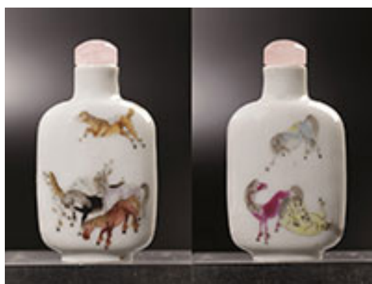
粉彩穆王八駿圖鼻煙壺 清·道光(西元1821-1850年) 懷海堂藏