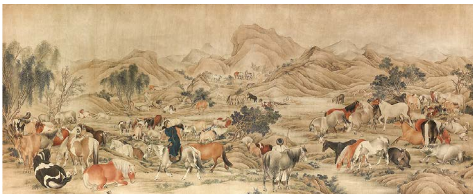
佚名 百駿圖 清·十九世紀 文物館藏品·趙寧國先生 惠贈