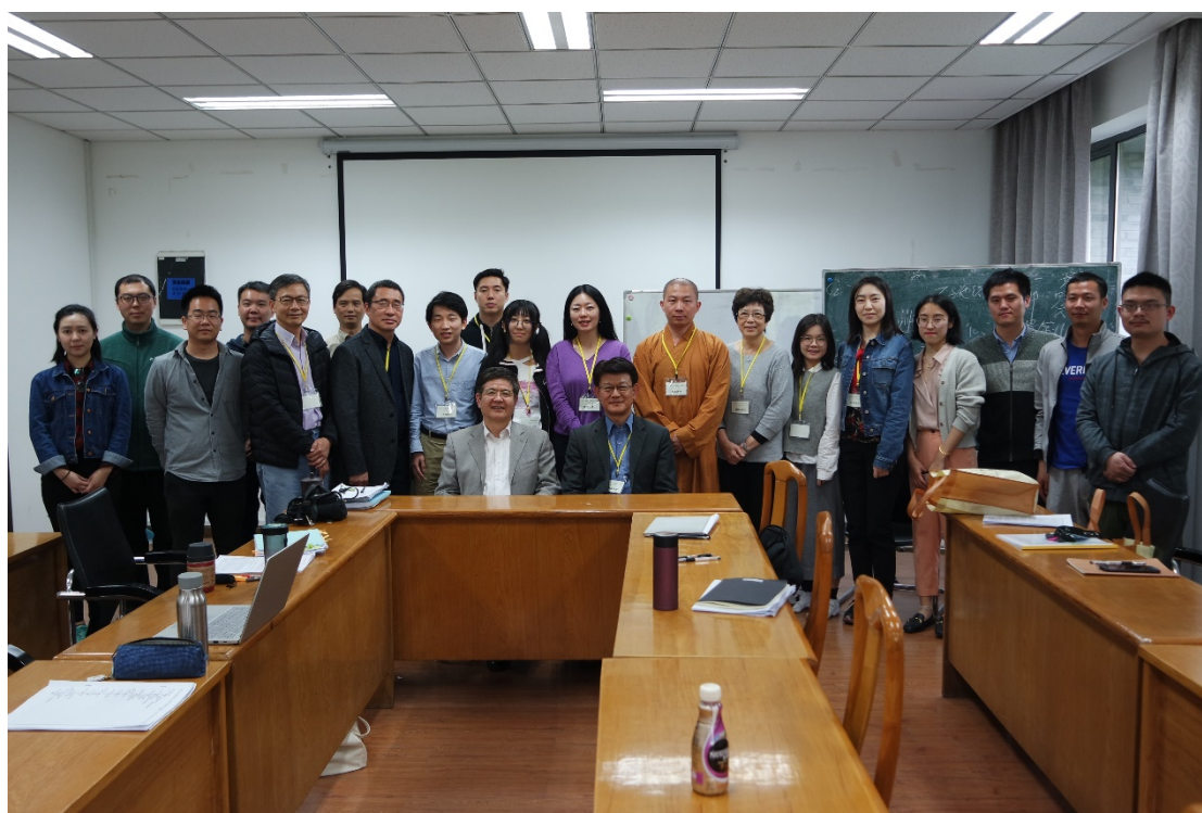
在洪教授的博士課程頗受啟迪

比較有深印象的是在洪教授一課中，在兩校師生交流互動環節中提到，在跨領域的學術交流時，譬如佛學學者跟一些新儒家人士討論有關儒釋的問題，學者們或許比較容易受到自己的觀點及立場影響，因而學術的訓練是非常重要的。跨領域的交流真不容易！