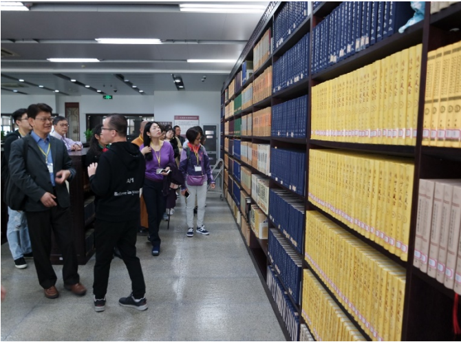
南京大學圖書館的佛典藏書

我們還參觀了南京大學的圖書館，圖書館館藏豐富，涉及佛學研究的書籍也很充分，從經典著作到近些年的新成果都有。不僅有漢語出版的書籍，英語、日語等語言的書籍也很多。聽哲學系的研究生講，他們經常在圖書館待很長時間閱讀文獻。這對研究是大有裨益的吧！圖書館的古藏室也有風采，各類的經書、歷史典籍頗有特色。還有人在專門修復、整理線裝書，使古籍重放光彩。