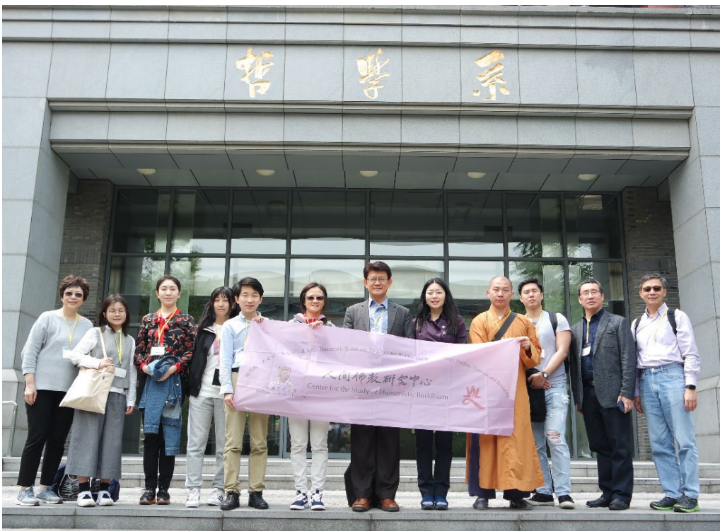
南京大學哲學系留影

二零一九年五月，正值春光明媚的季節，我和香港中文大學的老師、同學們一同訪問了南京大學，以及參觀了南京的佛教勝地。這次交流活動給我留下了深刻印象，使我受益良多。南京大學哲學系座落於風景優美的仙林校區，環境優雅，是適合學習的好地方。