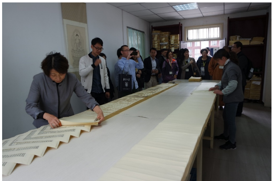
在金陵刻經處近距離了解經書刻印

在南京，我們還參訪了南京大學的鼓樓校區，體會到了歷史的厚重感。此外，我們參觀了著名的雞鳴寺。寺廟中有書畫展、圖書館，有豐富各類佛學書籍，讓人們可以近距離接觸佛教文化。雞鳴寺積極踐行人間佛教思想，有心理諮詢等服務，還提供完善的本科、研究生的佛學教育。在金陵刻經處，我近距離接觸了經書刻印的整個過程。雕板、刻字、印刷、編裝等步驟，幾乎全人手完成，是罕見的技術。我不禁感嘆，真是難得的體驗。這次的南京參訪活動令我難忘且受益良多，我非常感謝有這次機會到訪學術氛圍濃厚的南京大學和南京這座美麗的城市。