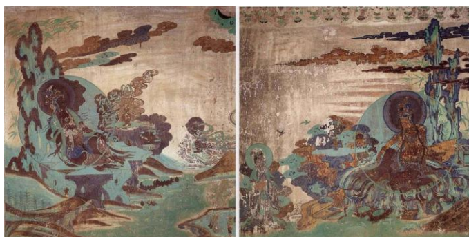
網絡圖片：榆林窟第2窟 水月觀音 (西壁北側、西壁南側各一幅)

水月觀音很有感覺; 觀音帶著瓔珞，衣服飄逸，很雍容，柔軟的身體靠著山石而坐，頭上有光環，昂著頭望着天空的彎月，還有流水及蓮花，工畫師畫出一個清靜無染的靜境。