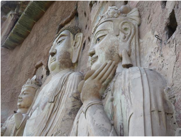
麥積山石壁上的佛像

旅程終站參訪大慈恩寺 —— 漢傳佛教唯識宗的祖庭。在住持法師的帶領下參觀寺院及登上大雁塔感受古時長安城的風貌。最感恩的是法師給我們機會，在這個從前是玄奘法師翻譯佛經的經場，向他頭骨舍利前上香頂禮及在法師帶領下，大家誦念玄奘法師所翻譯的心經一遍，真是難得的因緣。