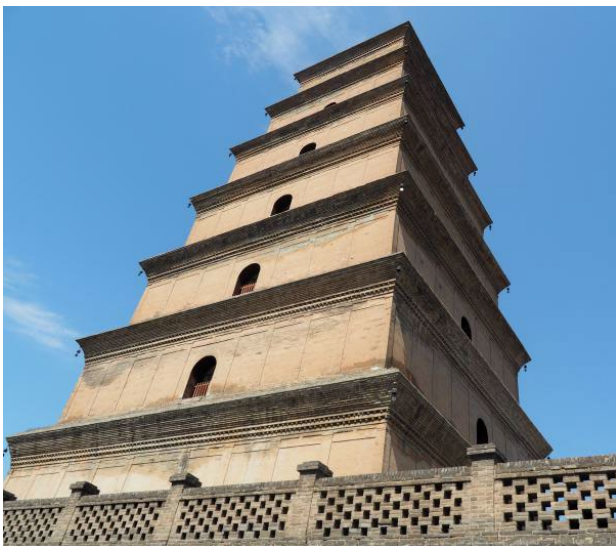
大慈恩寺佛塔（大雁塔）

旅程終站參訪大慈恩寺 —— 漢傳佛教唯識宗的祖庭。在住持法師的帶領下參觀寺院及登上大雁塔感受古時長安城的風貌。最感恩的是法師給我們機會，在這個從前是玄奘法師翻譯佛經的經場，向他頭骨舍利前上香頂禮及在法師帶領下，大家誦念玄奘法師所翻譯的心經一遍，真是難得的因緣。