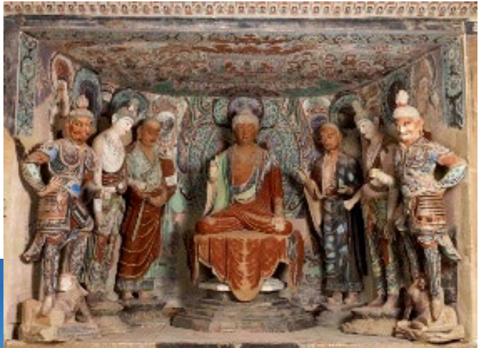
莫高窟第 45 窟圖

苦行表達出來。當我們蹲下看佛像時，他們的眼睛在望著我們，像佛菩薩以慈眼視眾生，讚歎當代工畫師高超的技術及心思。佛像後有六尊不同神態的菩薩繪畫，牆頂上壁畫的圖案很有立體感及色彩繽紛，眼前呈現一幅立體及亮麗的說法圖。