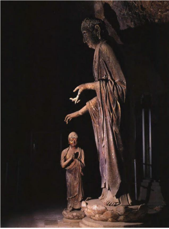
麥積山石窟第 133 窟 釋迦牟尼佛與羅睺羅