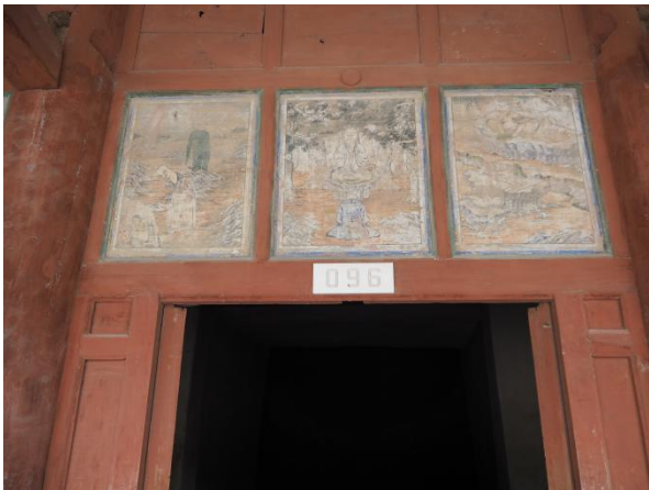
石窟的每一個細節都值得品味

雕塑家怎樣利用瀝粉貼金方法來營造出立體的效果；利用牆壁及頂部的雕繪技巧來營造立體及巨大的效果；利用光線及不同的角度呈現佛菩薩像表情的轉變，以及雕塑家怎樣混合使用一些簡陋的天然材料，而使這些壁畫及彩塑保存過千年的歷史，這些細緻的地方都令我感受到當時雕塑家的用心。