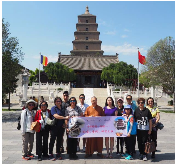
與大家有緣相聚在西安大慈恩寺