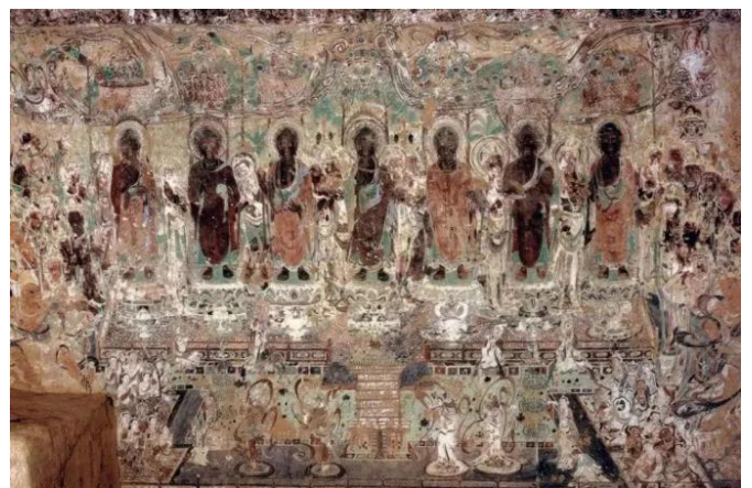
莫高窟第 220 窟的藥師七佛