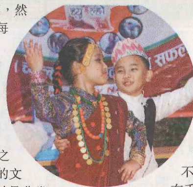
◀穿上古龍族服飾的孩子表演民族舞

古龍社是一個新成立的組織，在馬騮山舉辦過兩次勒賀察爾慶祝活動。與別的尼泊爾組織不同，他們的慶祝是在聖誕假期舉行的，既有文娛活動，例如推石、民族舞蹈和歌唱比