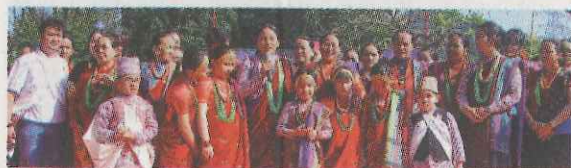
▲香港尼泊爾人在馬騮山（金山郊野公園）過年

現今大約有二萬五千名尼泊爾人居住在香港，雖然官方資料沒有以族群來顯示尼泊爾各族的人口分佈，但據估計，古龍應是最大的族群，佔在港尼泊爾人口一半以上。在英治時期，尼泊爾人多住在軍營，九七回歸以後，留港的尼泊爾人散居不同地區，而古龍族人口亦不斷上升。現今居港的古龍族是一個多元的族群，成員來自不同故鄉、有不同的宗教和語言。為滿足不同群體的需要，族群組織紛紛成立。香港古龍協會在一九九八年成立，是最早在香港成立的古龍組織，而香港古龍薩滿教協會和香港古龍社亦分別在二〇〇三年和二〇一五年成立。這些組織有不同的目標和功能，如香港古龍協會着重社交活動，香港古龍薩滿教協會着重文化遺產承傳，而香港古龍社則是兩