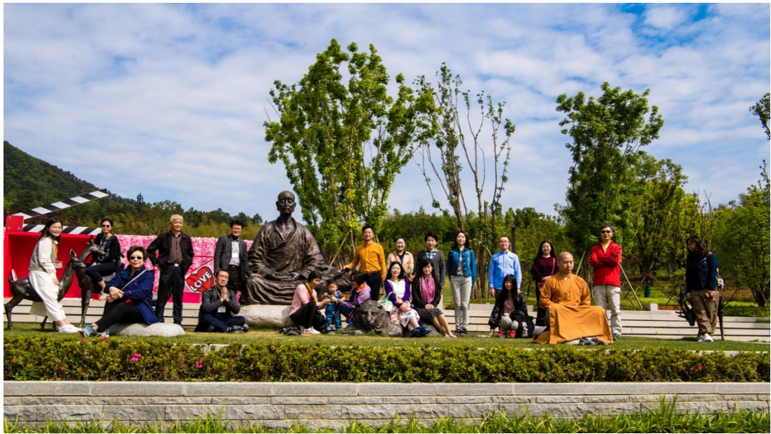
在南京牛首山的合影