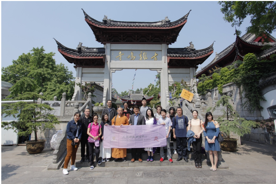
在南京雞鳴寺的合影