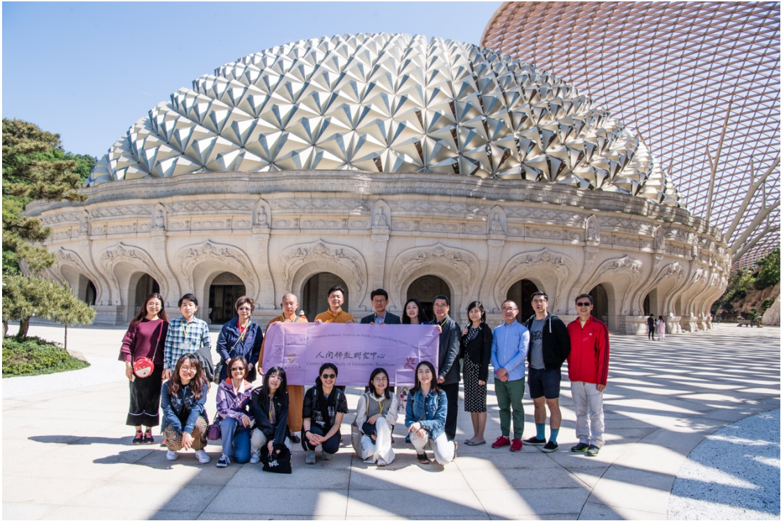
在南京牛首山的合影