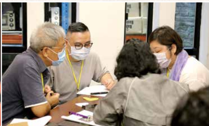
活動透過個別教案、生活故事、遊戲、影片及討論等，理解學習如何生死自在