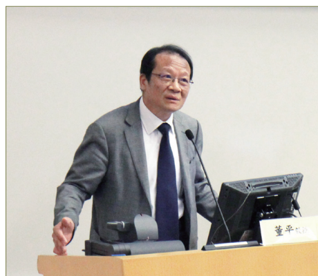
佛法與眾生法的協和： 論人間佛教的價值取向 董平/浙江大學佛教文化研究中心

文章最後指出目前全亞洲的佛教國家或受佛教影響的地區都有受「人間佛教」不同程度的影響，可以預期人間佛教將是全世界佛教的未來走向，亦是世界佛教界的共識。新的中國佛教進入了人間佛教時代，若充分發揮人間佛教的整合功能，在傳統的歷史文化基礎上，用新時代的人間佛教理論進一步推動與南亞、東南亞佛教界的交流，促使世界佛教界在人間佛教潮流影響下共同走人間佛教道路，這將成為中國人間佛教對當代世界佛教所能作出的最大貢獻。