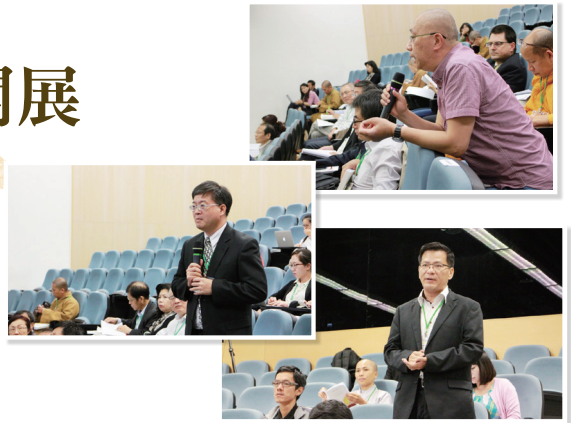
與會人士踴躍提問、心得交流。

聚焦東亞、東南亞人間佛教與人間淨土之研究 促進不同區域專家學者及宗教人士對話交流