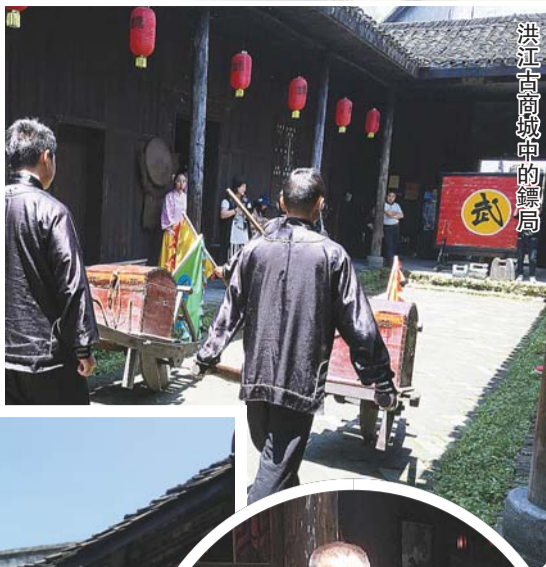
洪江古商城中的迎春樓