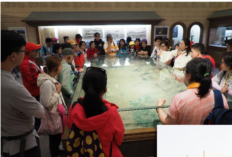
(上) 參訪陽關遺址博物館