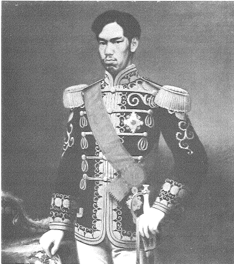
明治天皇的俸祿改革和士族授產政策，從經濟地位上徹底改造了舊武士集團的社會位置。

十九世紀末、二十世紀初年中國也出現了傳統士紳轉向近代工商企業的趨勢。雖士紳名流經商辦廠與日本明治時代的士族的變化有某些相似之處，但最大的差異在於後者是一種全局性的結構性變動，而清末士紳涉足工商業只是一些局部性的變化趨勢。