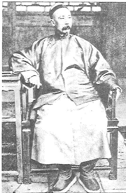
洋務派李鴻章(左)創辦江南製造局於上海和金陵機器局於南京(右)，但士林反應冷淡。