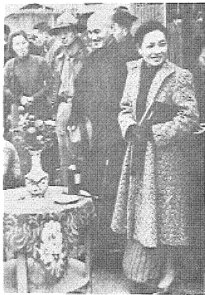
蔣介石在江西南昌發起新生活運動，不一定是為了替法西斯主義的藍衣社提供大眾化組織作準備。