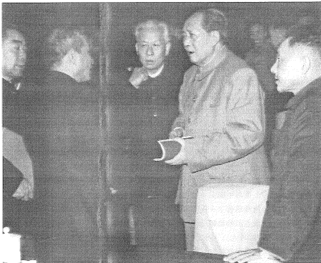
科技對建設富強中國的重要性一再被強調。可是，那些作為民族主義守護神的政治領導卻又輕易地抹煞了這些現代科技層人員的影響力。圖為中國著名的第一代領導人。

子中還有一些具有外國技術知識，或受過現代科學訓練。從1898年的改良運動，到五四運動，再到毛以後的四個現代化運動，科技對建設富強中國的重要性一再被強調。在其他殖民地國家，也許亦正是這一主題把民族主義和現代化聯繫起來的。可是，那些作為民族主義守護神的政治領導卻又輕易地抹煞了這些現代科技層人員的影響力。