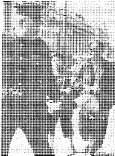
圖 許多左翼作家的作品中，代表帝國主義的洋人總是神通廣大而又心狠手辣，而工人和農民則深受壓迫。

儘管口岸華人在本身的現代化是成功的，但是他們卻無法為國家建立多元化市民社會的基礎。對創立新的現代中國民族主義，他們也同樣無能為力。這