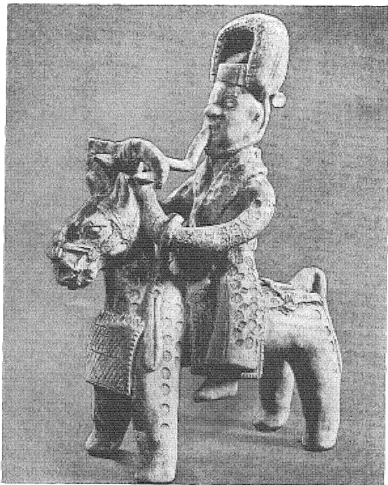
圖 「憂患意識」論者認為，中國的人文精神躁動於殷周之際，其基本動力便是憂患意識。

現，人自身的把握以及人自身的升進，與形成耶、佛二教的恐怖意識和苦業意識絕然不同。憂患意識在周初表現為「敬」，此後則融入於「禮」，爾後更升進為「仁」。從表面看來，人是通過「敬」等工夫而肯定自己的，本質地說，實乃天命、天道通過「敬」等工夫而步步下貫，貫注到人的身上，作為人的本體，成為人的「真實的主體性」。他們相信，基於憂患意識為基礎的心性之學，不僅是儒家思想的基本品格，也是中國文化的基礎，是孔孟老莊以至宋明理學乃至中國化了以後的佛學的一大條網維之所在 ① 。