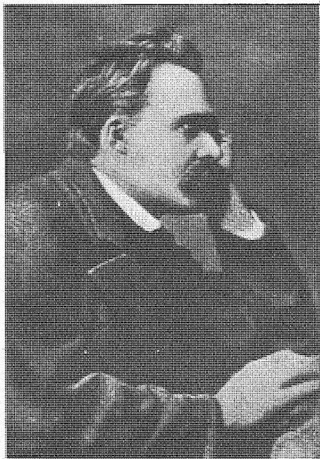
圖 尼采反對黑格爾形而上學的最主要之處在於黑格爾把無限的東西當作最真實的東西，在於黑格爾認為思想的概念範疇構成事物的基本規定，思想能把握實在。