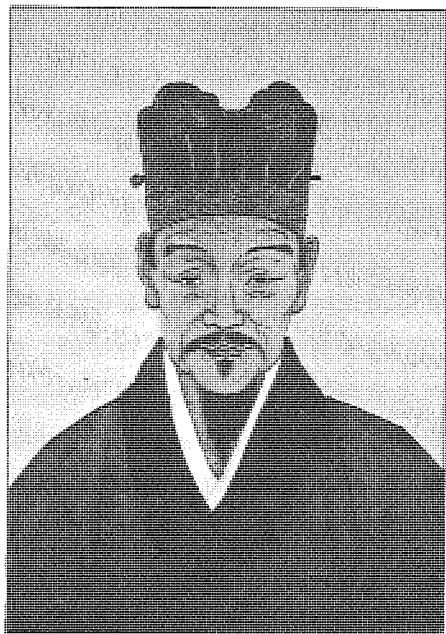
圖 李贄的思想在中國哲學史上可以說具有劃時代的意義。

最首要的一點是，李贄明確反對「一」和「太極」。「余謂本無一，又何守乎？」 ② 「有天地然後有萬物。然則天下萬物皆生於兩，不生於一明矣。而又謂一能生二，理能生氣，太極能生兩儀，何歟？夫厥初生人，惟是陰陽二氣，男女二命，初無所謂一與理也，而何太極之有。以今觀之，所謂一者果何物，所謂理者果何在，所謂太極者果何所指也？」 ③ 李贄在這裏說的就是不承認有天地萬物之上、之外、之先的「一」、「理」、「太極」，而主張只有對立（天地），只有萬物，