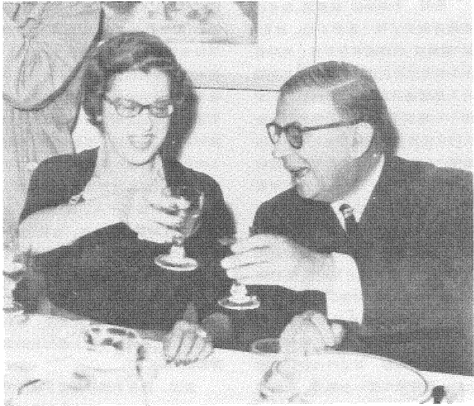
薩特的「選擇」理論，是在其「存在先於本質」的命題下凸現出來的，圖為薩特與波娃。

維方式、價值尺度和審美標準作為先驗的規範凝固起來，結成一種僵死的「心理板結層」來限制和壓抑着主體的創造力。人若屈服於這種「心理板結層」的壓力，就會變得因循守舊、故步自封，既缺乏實踐的革新精神，又失去了美的創造力。如此說來，被李澤厚視為美之根本的文化「積澱」，在劉曉波這裏則恰恰成了美的障礙物。「因此，對於人類來說，理性積澱必須被突破，注定被突破。理性積澱的不斷突破意味着生命的活力，而長期地沒有被突破則意味着感性生命的麻木、僵死。人類也好，個人也好，最可怕的莫過於感性生命中長期地積澱着理性，這種長期積澱會因為得不到來自感性生命力的經常衝擊而形成一種無意識心理板結層或『第二天性』，用自身的教條性、保守性、有限性去主宰感性生命，使之在任何情況下都很難擺脫理性的束縛。」②