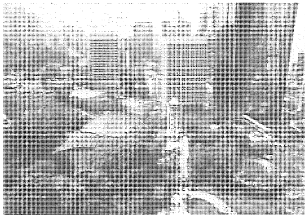
位於港島中心地區的香港公園鳥瞰

另一種較為嚴厲的批評是針對政府興建的公共屋邨的。政府曾通過法例，成立專責舊城區重建的土地發展公司，協助加快進行整體性的舊城重建計劃；香港房屋協會和香港房屋委員會也動用龐大的資源，改建原來的舊公共屋邨及興建新屋邨。雖然，改造計劃盡可能做到提供環境優美和設施充足的居住地區，但是由於土地資源的稀缺和其他種種條件限制，很多公共屋邨都顯得過份狹窄、擁擠，特別是在若干年後顯得陳舊；加上其中居住着大量收入較低的居民，於是很多人認為，這些大型屋邨代表着實用經濟目標控制城市設計思想，其後果是把大眾的貧窮制度化。這種尖銳的意見固然也代表了一種必須參考的角度。但是，不得不指出，大多數屋邨居民都樂於享受方便、設施充足、環境優美和價廉的居所。而且，它也不是一種不能改變的制度。目前，本港約有一半人口，即300萬人居住在較