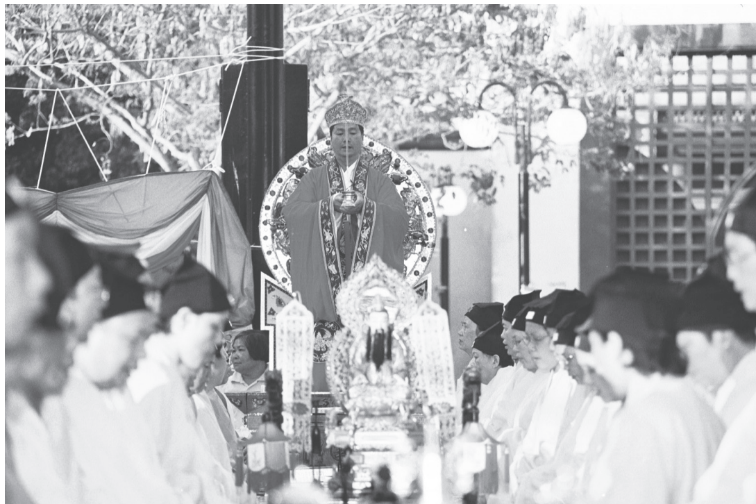
高功法師施演先天斛食濟煉儀式