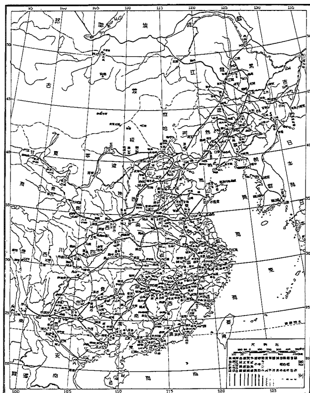
圖 民國時期鐵路圖