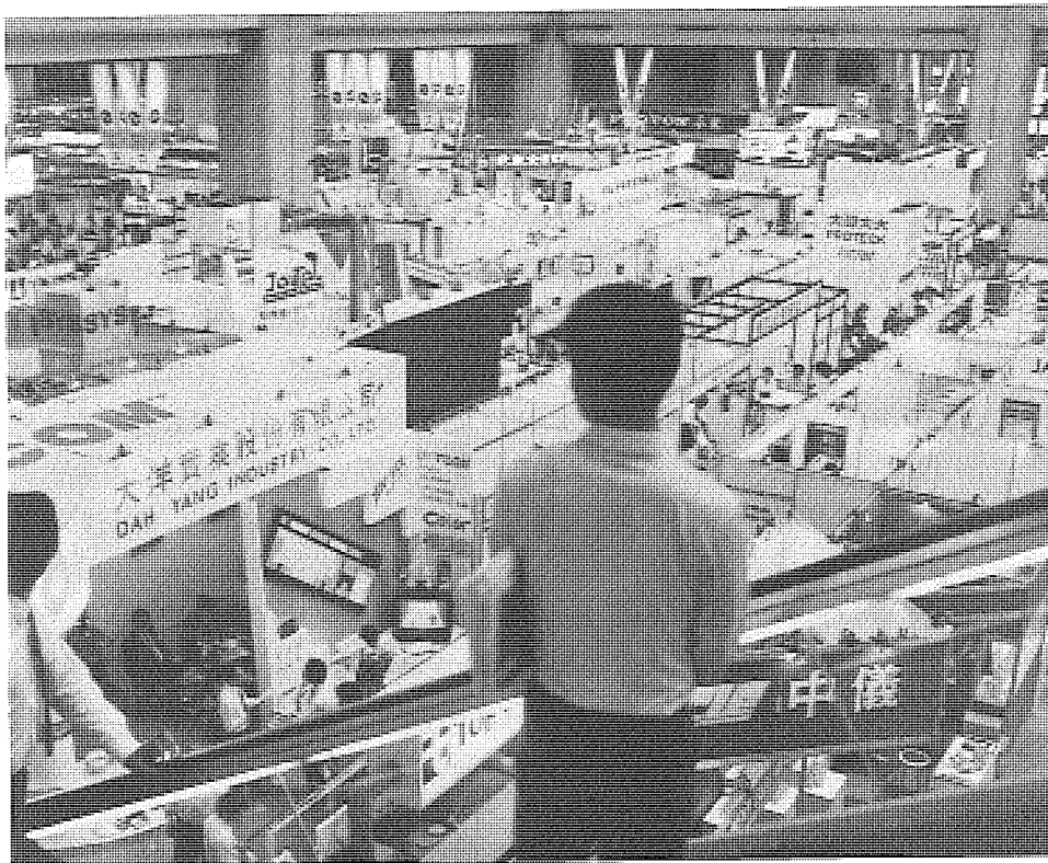
圖 台灣在專制政治體系下進行經濟改革，即在政治不自由的環境中，允許經濟活動的充分自由。

加，我們未能預為防患，但經濟成長後的生活方式改變，對社會與政治的開放，的確有它的強大壓力。目前台灣的政治民主化，距離應有的目標，固然還相當遙遠，可是，現有的政黨政治雛形，總是在工業化以後帶來的結果。這一點不僅與現代化理論不甚符合，與世界體系理論也不一致。