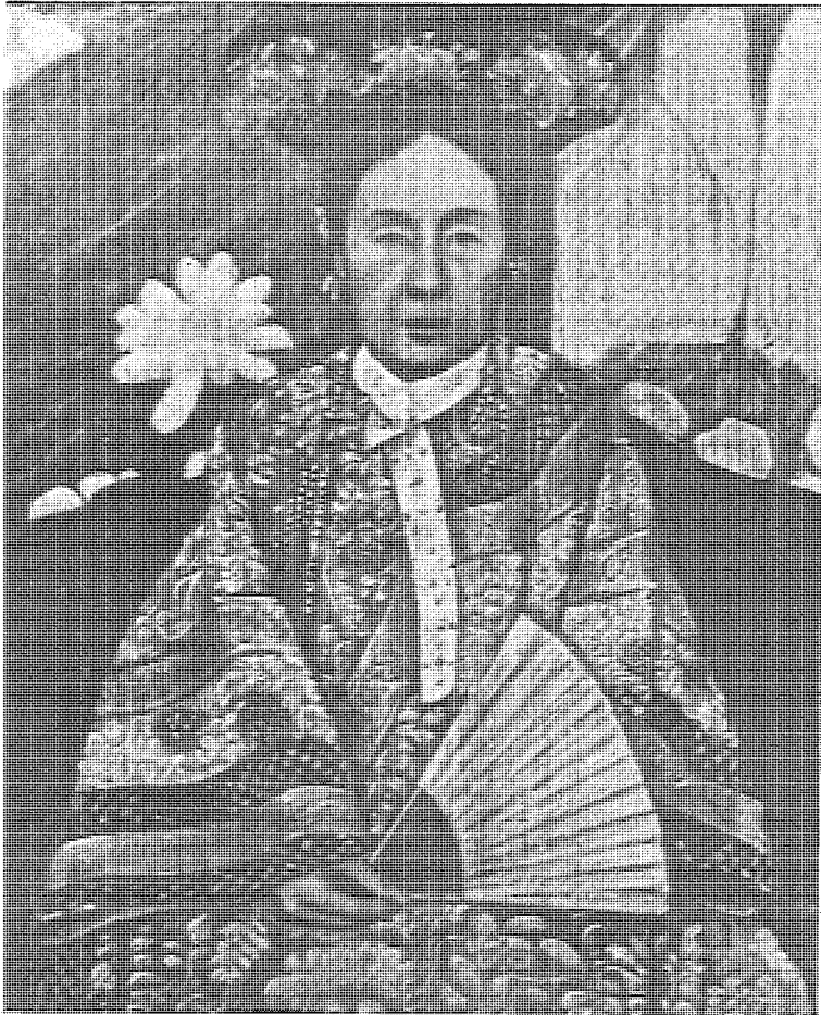
慈禧太后公開聲明， 立憲要對君權無害， 才能實行。