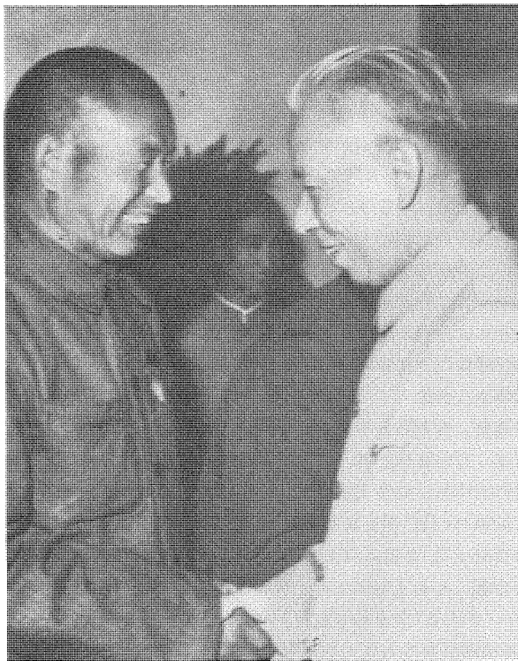
由於「先進人民」是中共政權的捍衛者，故甚得黨的多方禮遇。圖為劉少奇接見掏糞工人時傳祥。

先進人民的過程強化和制度化，由此可以證明「先進人民」集團發揮了中共所期望的作用。